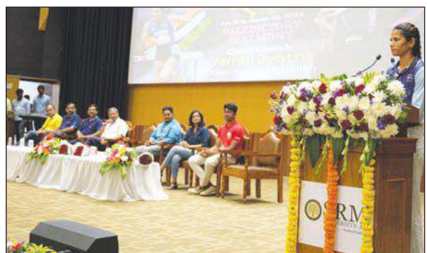
విశేష ప్రతిభ కనబరిచిన ఎస్ఆర్ఎం....

పంకగిరి, మేజర్ స్కూల్ : విద్యార్థులు చదువుతోపాటు క్రీడల్లోనూ రాణించేలా తల్లిదండ్రులు, అధ్యాపకులు ప్రోత్సహించాలని 2022 ఆసియా క్రీడల రజత పతక విజేత జ్యోతి యర్రాజీ కోరారు. ఏపీ ఎస్ఆర్ఎం యూనివర్సిటీలో ఉద్ఘాటన-24 పేరిట ఫిబ్రవరి 28 నుండి ప్రారంభమైన జాతీయ స్థాయి క్రీడా పోటీలు ఆదివారం ఘనంగా ముగిసాయి. ముగింపు కార్యక్రమానికి ముఖ్య అతిథిగా హాజరైన జ్యోతి యర్రాజీ మాట్లాడుతూ విద్యార్థులను చిన్నప్పటి నుంచే చదువుతో పాటు క్రీడల్లోనూ ప్రోత్సహిస్తే వారికి మంచి భవిష్యత్ అందించినట్లువుతుందన్నారు. ప్రోత్సాహంతోనే జిల్లా నుండి రాష్ట్ర, దేశ, అంతర్జాతీయంగా ఎదుగుతారన్నారు. ప్రపంచంలో భారత దేశం క్రీడల్లో గర్వించదగ్గ స్థానం కోసం ప్రతి ఒక్క క్రీడాకారులు శ్రమించాల్సిన అవసరం ఎంతైనా ఉందన్నారు.