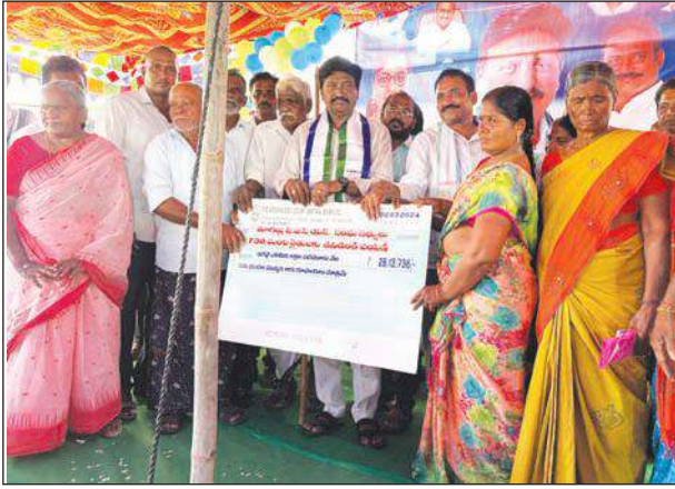
వైయస్సార్ విలేజ్ హెల్త్ క్లినిక్ ప్రారంభం