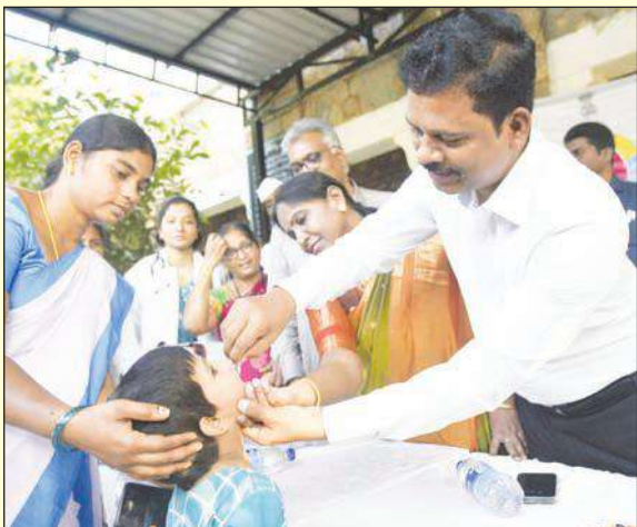
వేయించని పిల్లలకు పోలియో చుక్కలు వేసేలా చర్యలు తీసుకున్నామన్నారు. జిల్లాలో సుమారు 6 లక్షల 50 వేల గృహాలను పోలియో బృందాలు