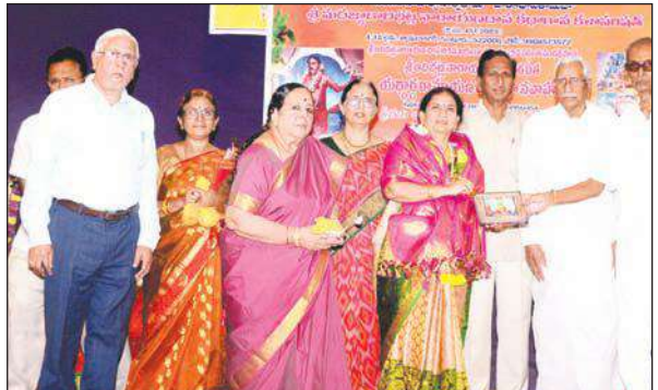
గుంటూరు (సాంస్కృతికం) మేజర్ స్కూల్ : స్థానిక బృందావన గార్డెన్స్ శ్రీ వేంకటేశ్వరస్వామి దేవాలయం ఆలయప్రాంగణం అన్నమయ్య కళావేదికపై

గుంటూరు రూరల్, మేజర్ స్కూల్: గుంటూరు మండలం లాలు పురం గ్రామం చెరువు కట్ట సమీపంలోని శ్రీ లక్ష్మీ తిరుపతమ్మ గోపయ్య స్వామి ఆలయంలో ఆదివారం భారీ అన్నదానం కార్యక్రమం జరిగింది. ఈ సందర్భంగా స్వామివార్లకు ప్రత్యేక పూజలు నిర్వహించారు. ఆలయ కమిటీ సభ్యులు కార్యక్రమాన్ని పర్యవేక్షించారు. లాలుపురం తో పాటుగా గుంటూరు పరిసర ప్రాంతాలకు చెందిన భక్తులు సుమారు 4 వేల మందికి పైగా హాజరయ్యారని కమిటీ సభ్యులు తెలిపారు.