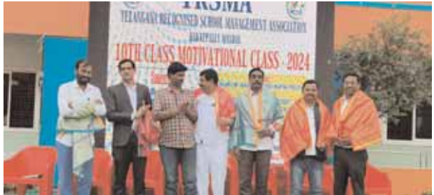
కూకట్ పల్లి, మేజర్ న్యూస్: ఆధ్వర్యంలో పల్లవి మోడల్ హైస్కూల్లో పదవ తరగతి