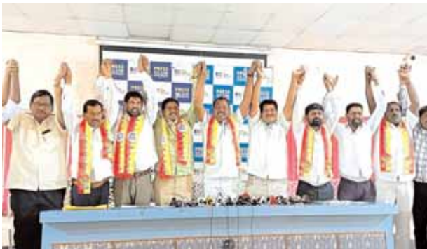
సోమాజిగూడ/మేజర్ న్యూస్: కోకాపేటలో గత ప్రభుత్వం మంజూరు చేసిన 5 ఎకరాల అత్యున్నత భవన స్థలం నిర్మాణ విషయంలో ఎమ్మెల్యే బండా ప్రకాష్ ఏకపక్ష నిర్ణయంతో తనకు సంబంధించిన ముగ్గురు వ్యక్తులతో ట్రస్టు ఏర్పాటు