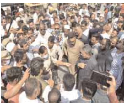
సిటీబ్యూరో,మేజర్ న్యూస్: గుడిమల్కాపూర్ మార్కెట్ ప్రధాన రోడ్డుకు ఇరువైపుల మార్కెట్ యార్డు గోడలకు అనుకుని వీధి వ్యాపారులు వేసుకున్న అక్రమ షెడ్యూలు శనివారం బల్లియా టౌన్ ప్లానింగ్ సర్కిల్ -12,13 ఏ.సి.పి.ల అధ్యక్షులలో