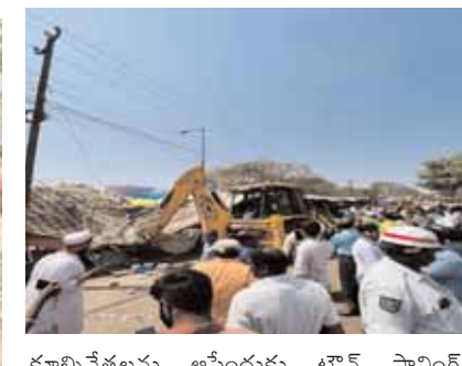
కూల్చివేతలను ఆపేందుకు టౌన్ ప్లానింగ్ అధికారులతో వాగ్వివాదానికి దిగారు. అంతేగాక పోలీసులతోకూడ ఘర్షణకు దిగారు. దీంతో ఇక్కడి పరిస్థితి ఉద్రిక్తతగా మారింది. గత్యంతరం లేక బల్లియా టౌన్ ప్లానింగ్ అధికారులు కూల్చివేతలను అర్థాంతరంగా ఆపివేశారు.