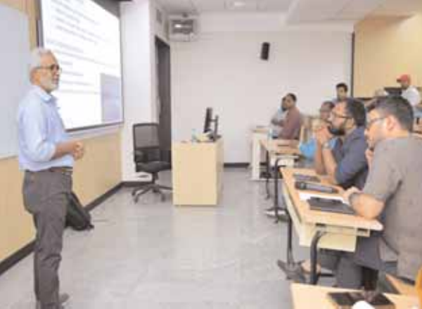
చేశారు.సామాజిక, పర్యావరణ సమస్యలను ఎత్తిచూపి,సానుకూల సూర్షాను తీసుకురావడాని కి నిపుణులను ఒకచోట చేర్చి, ఆయా అంశాలపై చర్చలను జీఎన్ హెచ్ఎస్ నిర్వహిస్తోంది.