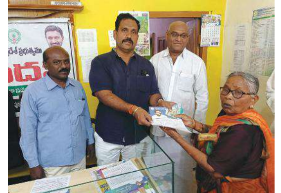
సిబ్బంది పెన్షన్ లభిదారులు తదితరులు పాల్గొన్నారు.