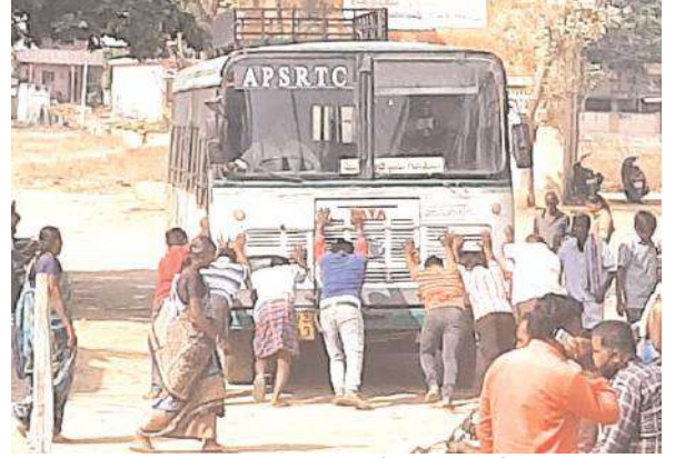
చెలగాటం ఆడుతున్నారని ప్రయాణికులు ఆవేదన వ్యక్తం చేశారు.

ములకలచెరువు, మేజర్స్ న్యూస్: ములకలచెరువు ఆర్టీసీ బస్టాండులో మదనపల్లి 1 డిపోకు చెందిన బస్సు శుక్రవారం మొరాయించింది. ములకల చెరువు నుండి గూడుపల్లికి వెళ్లే సర్వీస్ బస్సు బస్టాండుకు రాగా ప్రయాణికులు బస్సులో కూర్చున్న తరువాత డ్రైవర్ స్టార్ట్ చేయగా బస్సు కండిషన్ సరిగా లేకపోవడంతో అక్కడే నిలిచి పోయింది. చివరకు స్థానిక ప్రజలు, ప్రయాణికులు కలిసి తోసినా ఆ బస్సు ముందుకు కదలేదు. దీంతో ప్రయాణికులు ఇబ్బందులు పడ్డారు. ఆర్టీసీ అధికారులు కండిషన్ ఉన్న బస్సులను మారుమూల గ్రామాలకు పంపితే బాగుంటుందని ప్రయాణికులు కూడా సరైన సమయంలో తమ గమ్యస్థానాలకు చేరుకుంటారని, కండిషన్ లో లేని బస్సులు పంపడం వలన ప్రయాణికులు ఆటోలలో ప్రయాణించి ప్రమాదాలకు గురి అవుతున్నారని, ఆటోల వలన ప్రజలకు ఎంతో సష్టం జరుగుతుందని దానివలన ఆర్టీసీకి కూడా గండి పడుతుందని ఆటోలను నడిపే వారికి ఎటువంటి డ్రైవింగ్ లైసెన్సులు గాని వాహనముకు సంబంధించి రిజిస్ట్రేషన్ మరియు ఇన్సూరెన్స్ పత్రాలు లేకుండా, పరిమితికి మించి ప్రయాణికులను కూర్చోబెట్టుకొని సౌండ్ బాక్స్ లతో చప్పుడు చేసుకుంటూ అతివేగంగా నడుపుతూ ప్రజల జీవితాలతో