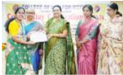
జూరిస్ట్రివిడెన్స్ విభాగాలతో పాటు ఎల్ఎల్బీ ఫస్ట్ ఇయర్, ఎల్ఎల్బి సెకండ్ ఇయర్, 2020-2023 బ్యాచ్ లో అత్యుత్తమ విద్యార్థినిగా అత్యుత్తమ ప్రతిభ కనబర్చినందుకు కళాశాల యజమాన్యం 8 బంగారు పతకాలతో