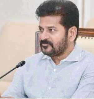
హైదరాబాద్, :: దేశంలో అత్యంత శక్తివంతమైన వ్యక్తుల జాబితా లో ఎనుముల రేవంత్ రెడ్డి పేరు వచ్చింది. రానున్న లోక్ సభ ఎన్నికల నేపథ్యంలో దేశంలో 100 మంది అత్యంత శక్తివంతులైన భారతీయుల జాబితా విడుదల చేసిన ప్రముఖ జాతీయ మీడియా సంస్థ ఇండియన్ ఎక్స్ ప్రెస్. జాబితాలో కేంద్ర మంత్రులు, ముఖ్యమంత్రులు, న్యాయమూర్తులు, సీని కళాకారులు, క్రీడాకారులు సహా వివిధ రంగాలుకు చెందిన ప్రముఖులు ఉన్నారు.