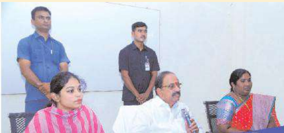
ఖమ్మం, (సూర్య బ్యూరో):

ప్రభుత్వం అందిస్తున్న సంక్షేమ ఫలాలను ప్రజల్లోకి తీసుకెళ్లేందుకు అధికారులు పనిచేయాలని రాష్ట్ర వ్యవసాయ, సహకార, మార్కెటింగ్, జాబి శాఖల మంత్రి తుమ్మల నాగేశ్వరరావు అధికారులను ఆదేశించారు. ఆదివారం రఘునాథపాలెం మండల ఎంపీడీవో కార్యాలయంలో రఘునాథపాలెం మండల అధికారులతో సమీక్ష సమావేశం నిర్వహించారు. ఈ సందర్భంగా మంత్రి మాట్లాడుతూ, మండలంలో నీటి ఎద్దడి లేకుండా చర్యలు తీసుకోవాలని సూచించారు. వైద్య, రోడ్డు పనులను పూర్తి చేయాలన్నారు. ప్రజల సమస్యలను పరిష్కరించేందుకు అధికారులు ప్రజలకు జవాబుదారితనంగా ఉండాలన్నారు. మండలంలో భూముల సర్వే కోసం రైతులు దరఖాస్తులు చేసుకుంటే సర్వేలు పూర్తి చేయాలన్నారు. జీరో కరెంటు బిల్లు కోసం ఎవరైనా అర్హులు ఉంటే వారికి పథకం వర్తించేలా చర్యలు తీసుకోవాలన్నారు. రోడ్ల పనుల ప్రతిపాదనలు ఉంటే వెంటనే జిల్లా కలెక్టర్ కి సమర్పించాలని సూచించారు. గతంలో మండలంలో నిలిచిపోయిన పనులను త్వరితగతిన పూర్తి చేయాలని ఆదేశించారు. గ్రామాల్లోని అంగన్వాడీ కేంద్రాల్లో కార్యకర్తలు ప్రజలకు అందుబాటులో ఉండాలన్నారు. అభివృద్ధి పనుల్లో ఏమైనా ఇబ్బందులు ఉంటే జిల్లా కలెక్టర్ దృష్టికి తీసుకెళ్లాలని మంత్రి అన్నారు.