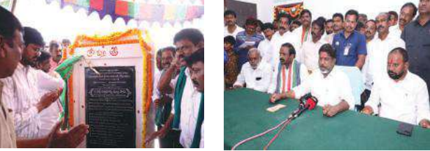
ఖమ్మం, (సూర్య బ్యూరో):