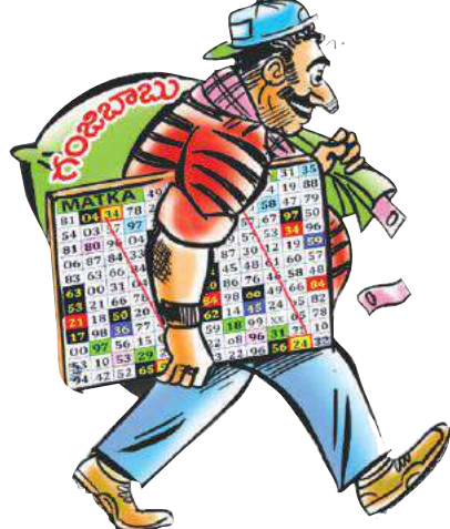
రోజంతా కష్టపడి సంపాదించిన కూలి డబ్బులంతా మట్కా సంబర్ణ ఆటలో పొగొట్టుకుంటున్న

గతంలో చీటీల రూపంలో మట్కా ఆట ఆడేవారు. ప్రస్తుతం పెరిగిన టెక్నాలజీని వినియోగించుకొని సెల్ ఫోన్ల ద్వారా, ఎక్కువ శాతం చదువు రాని వారి దగ్గర చిటీల రూపంలో మట్కా దందా నిర్వహిస్తున్నారు. మట్కా నిర్వహిస్తున్న వారు, ఆడుతున్న వారిలో తరచూ ఒకరిద్దరూ పోలీసులకు పట్టు బడుతున్నప్పటికీ పెద్దగా ప్రయోజనం కనిపించడం లేదు. ప్రత్యేకంగా ఏజెంట్లను ఏర్పాటు చేసుకొని దందాను విస్తరించుకుంటున్నారు. -గూడెం కేంద్రంగా లక్ష్మీదేవిపల్లి మండల కేంద్రంలో ఎక్కువగా.... కొత్తగూడెం పట్టణ ప్రాంతంలో రోడ్డుపై ఉన్న షాప్ కేంద్రంగా లక్ష్మీదేవిపల్లి మండలంలోని చాకకొండ కేంద్రంగా మట్కా నడుస్తోంది. జిల్లాలో రోజుకు రూ. 10 రూపాయల నుంచి లక్షల వరకు మట్కా జూదం నడుస్తున్నట్లు అంచనా ఉంది. ఈ జూదంలో ఒక్కో ఏజెంట్ రోజుకు రూ. 5 వేల నుంచి రూ. 10 వేల వరకు సంపాదిస్తున్నారని సమాచారం.