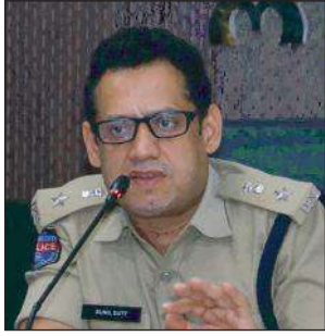
ఫ్లయింగ్ స్కాడ్,ఎన్ ఎస్సీ బృందాలు పూర్తి స్థాయిలో వారి విధులు సమర్థవంతంగా నిర్వహించాలి