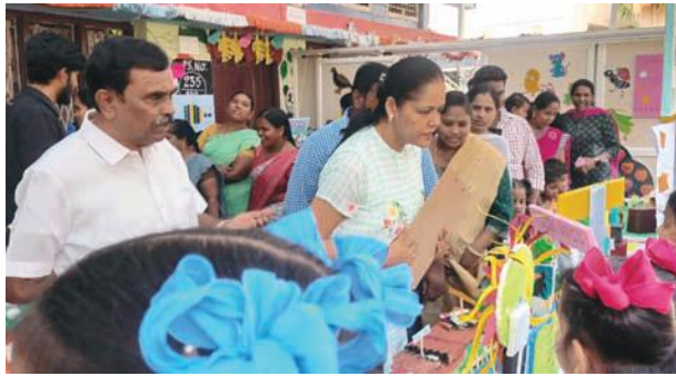
కార్యక్రమాన్ని విజయ వంతం చేశారు.