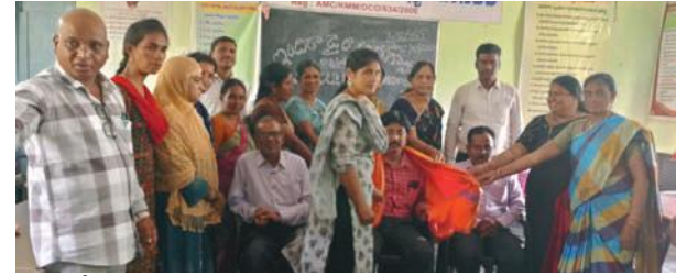
పసల్ డిర్లీ ఓ బాలస్వామి, సూర్యదీప్లను సన్మానించడం జరిగినది.