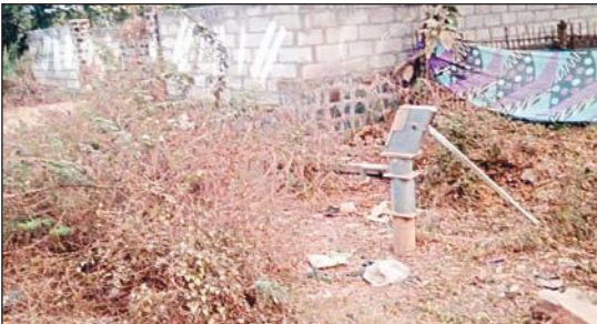
చెందిన శీలం అప్పారావు. డి.ప్రసాద్ లు కోరారు.

నేలకొండపల్లి సూర్య మేజర్ న్యూస్ : మండల పరిధి లోని అప్పలనరసింహాపురం లో గొంతెండుతున్నా...అధికార యంత్రాంగం పట్టించుకోవటం లేదని ప్రజలు అగ్రహం వ్యక్తం చేస్తున్నారు. గ్రామంలో ఉన్న 20 చేతి పంపులు మరమ్మతులకు నోచుకోక పోవటంతో ప్రజలు తాగునీటి కోసం అల్లాడుతున్నారు. అధికారులకు ఫిర్యాదు చేసిన పట్టించుకోవటం లేదని ఆవేదన వ్యక్తం చేశారు. ఇదే పరిస్థితి కొనసాగితే గ్రామంలో తాగునీటి కోసం కొట్లాట జరగటం తప్పదని హెచ్చరించారు. ఇప్పటికైనా అధికారులు స్పందించకపోతే కలెక్టర్ కార్యాలయం వద్ద గ్రామం మొత్తం వెళ్లి ఆందోళన చేస్తామని హెచ్చరించారు. మా గోడు ను అర్థం చేసుకోవాలని గ్రామానికి