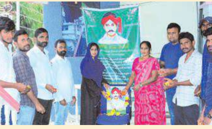
ఖమ్మం టౌన్ సూర్య మేజర్ స్యూస్