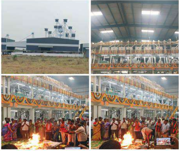
అనంతరం వారికి అన్నదాన కార్యక్రమాన్ని చేపట్టారు.