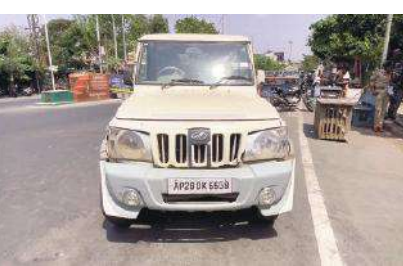
గంజాయి మార్కెట్ విలువ రూ 16 లక్షల 75 వేలు ఉంటుందని అక్రమ గంజాయిని తరలిస్తున్న వ్యక్తి పై కేసు నమోదు చేసినట్లు ఆయన తెలిపారు.