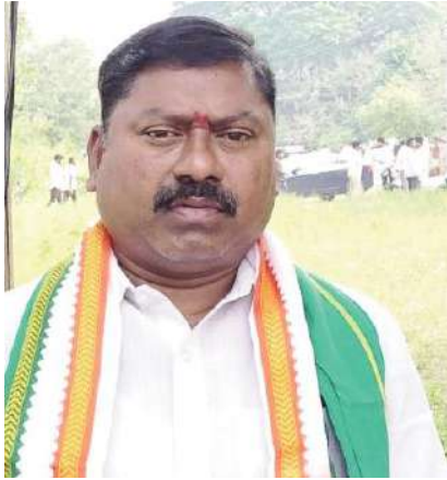
కేంద్ర ప్రభుత్వ కుట్రలో భాగంగా ఢిల్లీ ముఖ్యమంత్రి కేజ్రీవాల్ ను అరెస్టు చేయడం అప్రాజ్ఞాస్వామికం

ఇల్లందు టౌన్, సూర్య (మేజర్ న్యూస్) - భారతదేశంలో బిజెపి నరేంద్ర మోడీ ప్రభుత్వం రామరాజ్యం పేరుతో రాక్షస నియంత పాలనచేస్తున్నాడని రానున్న పార్లమెంటు ఎన్నికలలో బిజెపి పాలనకు చరమగీతం పాదాలిని కాంగ్రెస్ పార్టీ సీనియర్ నాయకులు తుడుం దెబ్బ రాష్ట్ర నాయకులు ఈసం నరసింహారావు ప్రజలకు విజ్ఞప్తి చేశారు. అధికారం అందతో ఈడి, ఏసీబీ, సంస్థలను అధికారానికి వాడుకుంటూ నీతి నిజాయితీగా ప్రభుత్వాలను కొనసాగిస్తున్న రాష్ట్రాల ముఖ్యమంత్రులపై దాడులను చేస్తున్నారన్నారు. ప్రజల మద్దతు పొందలేక కొన్ని రాష్ట్రాల్లో బిజెపి పార్టీ అక్కడ ఉన్నటువంటి ప్రభుత్వ ముఖ్యమంత్రులను ఆర్థిక లావాదేవీల కేసులలో ఇరికించి ప్రజలలో వారు అవినీతిపరులు అని ముద్రవేసే కుట్రలు చేస్తున్నారని విమర్శించారు.