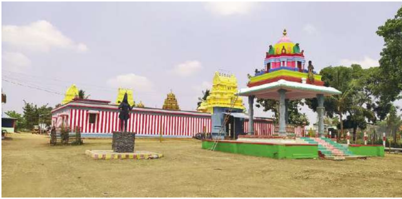
అవుతాయి. బ్రహ్మోత్సవాల సందర్భంగా ప్రతిరోజు ఆధ్యాత్మిక, సంగీత- సాంస్కృతిక కార్యక్రమాలు నిర్వహించబడుతున్నాయి. బ్రహ్మోత్సవాలలో ఎటువంటి అవాంఛనీయ సంఘటనలు జరగకుండా