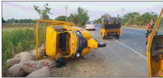
ఇద్దరికి వ్యక్తులకు గాయాలు

పెనుబల్లి సూర్య మేజర్ న్యూస్ : పెనుబల్లి మండలంలో జరిగిన రోడ్డు ప్రమాదంలో ఇద్దరి వ్యక్తులకు తీవ్ర గాయాలు అయ్యాయి. పెనుబల్లి మండలం తుమ్మలపల్లి వద్ద జాతీయ రహదారిపై ట్రక్ ఆటో, కారు డీకొనడంతో కారులో ప్రయాణిస్తున్న ఒకరికి గాయాలు కాగా ఆటో డ్రైవర్ కి తీవ్ర గాయాలు అయ్యాయి. తిరువూరు నుండి ఉల్లిపాయ లోడుతో సత్తుపల్లికి వెళుతున్న ట్రక్ ఆటో, ఏపీ రాష్ట్రం గన్నవరానికి చెందిన కుటుంబ సభ్యులు కొత్తగూడెంలోని వివాహానికి హాజరై తిరిగి గన్నవరం వెళు