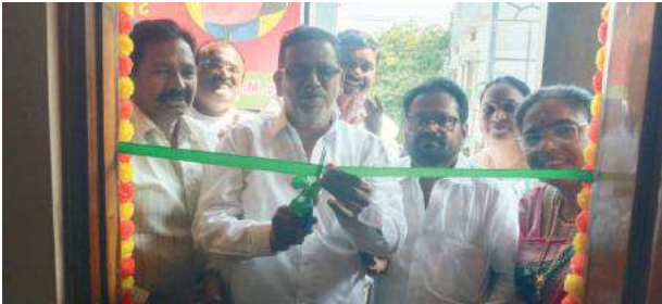
ఖమ్మం,సూర్య (మేజర్ న్యూస్)

ఖమ్మం నగరంలో 23వ డివిజన్ పరిధిలో మిషన్ హాస్పిటల్ ఎదురుగా ఎస్ ఆర్ సోకెన్ ఇంగ్లీష్ అకాడమీ ఇన్స్టిట్యూట్ ఏర్పాటు చేయడం జరిగింది. ఈ ఇన్స్టిట్యూట్ ను డివిజన్ కార్పొరేటర్ షేక్ మక్కూల్ గవేతుల మీదుగా ప్రారంభించడం జరిగింది. తెలుగు ద్వారా ఇంగ్లీష్ చదవడం, వ్రాయడం, మాట్లాడటం, బేసిక్ నుండి నేర్పించబడును అని, 8వ తరగతి నుండి ఇంటర్ విద్యార్థులకు ఇంగ్లీష్ గ్రామర్ మరియు మ్యాథ్స్, ఫిజిక్స్ క్లాసెస్ చెప్పబడును అని, అన్ని రకాల పోటీ పరీక్షలకు సిద్ధమయ్యే అభ్యర్థులకు ఇంగ్లీష్ క్లాసెస్ ( గ్రూప్స్, టెట్, డి.ఎస్.సి ), 9 నుండి 15 సంవత్సరాల పిల్లలకు సమూర్ సెషన్ల క్లాసెస్