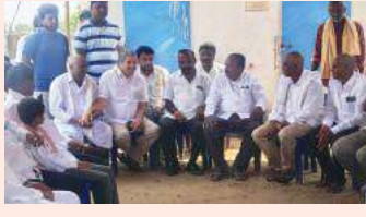
సింగరేణి సూర్య మేజర్ న్యూస్ సింగరేణి(కారేపల్లి మార్చి28) రాష్ట్రంలో ఆకాశవాదులందరూ బీఆర్ఎస్ ను విడుతున్న వారితో

-పదవులు ఆశించి కాదు ప్రజాసేవకు రాజకీయాల్లోకి వచ్చా..