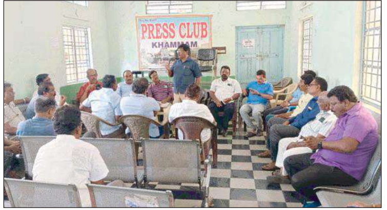
హాజరుకానున్న సిఎం, పలువురు రాష్ట్ర మంత్రులు