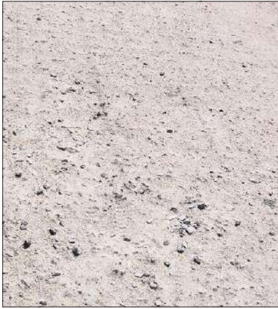
లేనప్పుడే ప్రశాంతంగా ఉందని ఈ నాణ్యత లేని రోడ్డు వేయడం వల్ల ఉదయాన్నే చీపిరితో ఊడిచితే కంకర చిప్స్ వస్తున్నాయని స్థానిక మహిళలు వాపోతున్నారు. రోడ్డుపై కంకర బయటపడటంతో

లక్ష్మీదేవిపల్లి, సూర్య (మేజర్ న్యూస్)- మండలంలో ఇటీవల నిర్మించిన సిసి రోడ్ల నిర్మాణం ప్రజలకు కష్టాలు తెచ్చిపెట్టింది. పదికాలాలు పదిలంగా ఉండాల్సిన సిసి రోడ్ల నిర్మాణం కాంట్రాక్టర్ల కక్కుర్తికి నెలలు గడవకముందే కంకర తేలుతూ దర్శనమిస్తున్నాయి. అధికారుల పర్యవేక్షణలో దగ్గర ఉండి చేయాల్సిన రోడ్లను కొందరు అధికారులు అవ్యూహాలకు కక్కుర్తి పడి పరివేక్షణ కూడా లేకుండా గోదావరి ఇసుకతో వేయాల్సిన సిసి రోడ్లను స్థానిక వాగులలో దొరికే నాణ్యతలేని ఇసుక, రోడ్డు వేసేటప్పుడు తగిన మోతాదులో కంకర ఇసుకకు తగ్గ సిమెంట్ వేయక నాణ్యత లేక వేసిన కొద్ది రోజులకే కంకర తేలుతూ దర్శనమిస్తుంది. ప్రజలు ఆ రోడ్లమీద నడవాలంటేనే తీవ్ర ఇబ్బందులకు గురవుతున్నారు గతంలో రోడ్డు