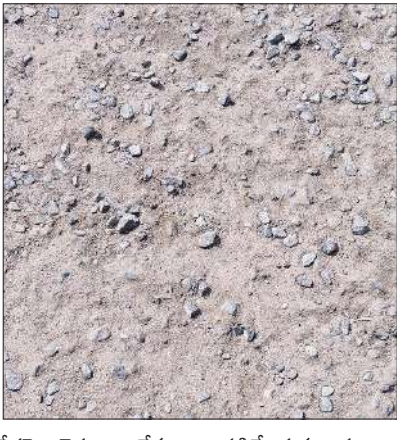
రోడ్డుపై చెప్పులు లేకుండా నడిచేందుకు ప్రజలు ఇబ్బందులు ఎదుర్కొంటున్నారని కంకర పాదాల్లో గుచ్చుకు ఉండడంతో రాకపోకలు సాగించేందుకు అవస్థలు పడుతున్నాయి.