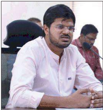
ఖమ్మం (సూర్య బ్యూరో) పట్టణ ప్రజల ఎమ్మెల్యే ఎల్.కె.ఎస్. పై జిల్లా కలెక్టర్, వి.పి.గాతమ్ గుర్తింపు పొందిన అన్నీ రాజకీయ పార్టీ ప్రతినిధులతో గురువారం డి.పి.ఆర్. సి భవన్ లో లోకసభ ఎన్నికల ప్రక్రియ ఎమ్మెల్యే పట్టణ ప్రజల ఓటర్ల జాబితా గురించి సమావేశం ఏర్పాటు చేశారు. ఈ సమావేశంలో పలు అంశాల గురించి చర్చించారు. లోక్ సభ ఎన్నికల ప్రక్రియకు సంబంధించి, ఏదేని పోలింగ్ కేంద్రంలో 1500 కన్నా ఎక్కువ ఓటర్లు ఉన్న చోట ఓటర్లు నివసించే ప్రాంతానికి పోలింగ్ కేంద్రంకు రెండు కి. మీ కన్నా ఎక్కువ దూరం ఉన్న చోట అక్షయ క్రొత్త పోలింగ్ కేంద్రాల ఏర్పాటు గురించి పోలింగ్ కేంద్రాల సవరణల గురించి చర్చించారు. ఇట్టి సమావేశంలో క్రొత్త పోలింగ్ కేంద్రాల ఏర్పాటు, పోలింగ్ కేంద్రాల పేరు మార్పు పోలింగ్ కేంద్రం ప్రదేశం మార్పు ప్రతిపాదనల గురించి అన్ని రాజకీయ పార్టీలకు వివరించారు. అన్ని రాజకీయ పార్టీలు పైన తెలిపిన పోలింగ్ కేంద్రాల ప్రతిపాదనలను ఏకగ్రీవంగా ఆమోదం తెలిపినారు పట్టణ ప్రజల ఓటర్ల జాబితా