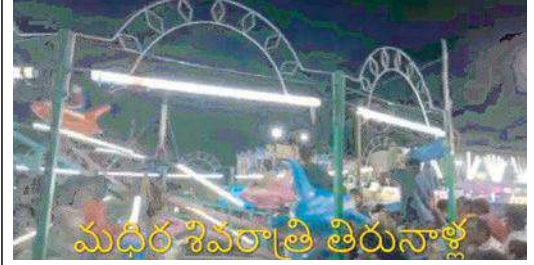
మధిర శివరాత్రి తిరునాళ్లు

ఇక్కడి దేవాలయంలో ఐదు ద్వారాలు కలిగి ఉండటం దేవాలయం యొక్క ప్రత్యేకత విశిష్టత. అంతేకాకుండా కాశీ తరహాలో దేవాలయానికి ఉత్తర దిక్కున వైకుంఠామం, పడమటి దిక్కున తూర్పు ఉత్తర దిక్కు నుండి దక్షిణ దిక్కుగా ప్రవహించే వైరా నది, తూర్పు దిక్కున మధిర పట్టణం ఉండటం ఇక్కడి ప్రత్యేకత ప్రతి సంవత్సరం ఆలయ నిర్వాహకులు అంగరంగ వైభవంగా మహాశివరాత్రి నాడు శివపార్వతుల కళ్యాణ మహోత్సవ వేడుకలు నిర్వహించడం, మహా జాతర కార్యక్రమం నిర్వహిస్తారు శివపార్వతులకళ్యాణం వీక్షించేందుకు ఖమ్మం జిల్లా పరిసర జిల్లాల నుంచి ప్రజలు వేల సంఖ్యలో పాల్గొంటారు.