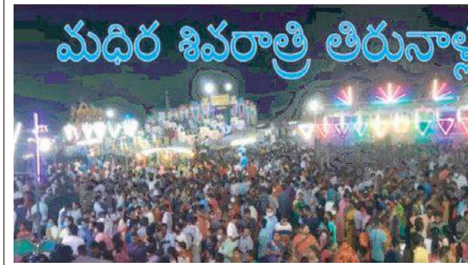
మధిర శివరాత్రి తిరునాళ్లు

ప్రతి సంవత్సరం మహాశివరాత్రి సందర్భంగా మధిర శ్రీ మృత్యుంజయ స్వామి వారి దేవాలయ ప్రాంగణమునందు పొట్టెలు పందాలు ఎడ్ల పందాలు నిర్వహించడం ఆనవాయితీ. ఈ పందాలను ఆలయ కమిటీ నిర్వహిస్తూ ఉంటుంది. ఈ ఆలయానికి ప్రతి సంవత్సరం అధికారంలో ఉన్న స్థానిక నాయకులు ఒక కమిటీ ఏర్పాటు చేసి ఈ జాతర సందర్భంగా జరిగే కార్యక్రమాలు నిర్వహిస్తూ ఉంటారు. ఈ కమిటీతోపాటు ఆలయ ఈవో పూజారి తదితరులు పాల్గొంటూ ఉంటారు