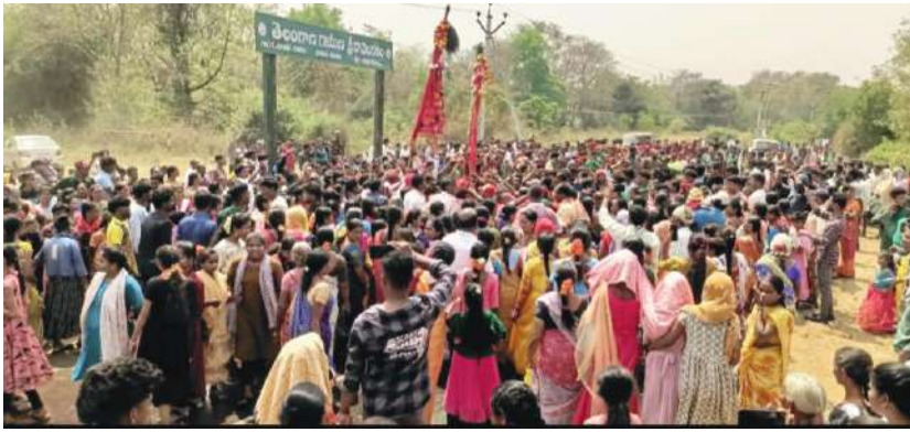
వనదేవతలకు మొక్కులు చెల్లించుకున్నారు.

గుండాల, సూర్య (మేజర్ న్యూస్) - ఆసియా ఖండంలోనే అతిపెద్ద గిరిజన జాతరైన మేడారం సమ్మక్క భర్త పగిడిద్ద రాజు జాతరను మండల పరిధిలోని యావలగడ్డలో అరెమ్ వంశీయులు ప్రతి సంవత్సరం ఘనంగా మూడు రోజులపాటు నిర్వహిస్తుంటారు. రెండవ రోజైన గురువారం వనదేవతను వనం నుండి జనంలోకి ఆదివాసి సంప్రదాయాల నడుమ అత్యంత భక్తి శ్రద్ధలతో ఘనంగా తీసుకువచ్చి సమ్మక్క పగిడిద్దరాజు ఎదురిల్లు కార్యక్రమం ఘనంగా నిర్వహించారు. అనంతరం యావలగడ్డ సమీపంలోని గద్దలపై ప్రతిష్ఠించారు. ఈ కార్యక్రమాన్ని తిలకించుటకై ఉమ్మడి ఖమ్మం, వరంగల్ జిల్లాలతో పాటు ఇతర జిల్లాల నుండి భక్తులు అధిక సంఖ్యలో పాల్గొని