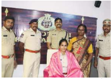
- మహిళా దినోత్సవ వేడుకలలో జిల్లా ఎస్పీ రోహిత్ రాజు