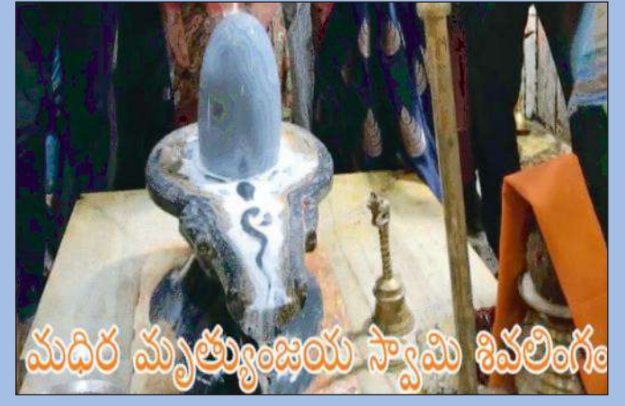
మధిర మృత్యుంజయ స్వామి శివలింగం

మృత్యుంజయ స్వామివారి కళ్యాణ మహోత్సవం నేటినుండి ఐదు రోజులపాటు జరగనున్న మహాశివరాత్రి జాతర