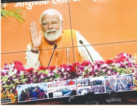
ఎస్ హెచ్ జి పథక సభ్యులతో చర్చ గోష్టిలో ప్రధానమంత్రి నరేంద్ర మోడీ