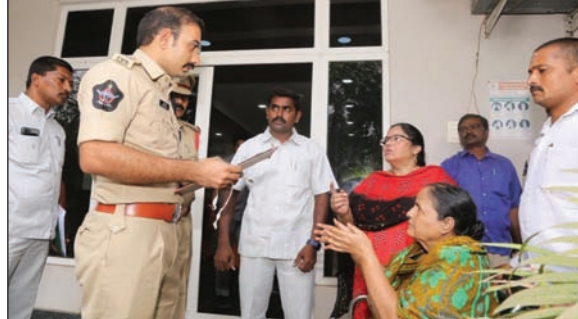
సంబంధమైన విషయాలు, మోసా లకు సంబం