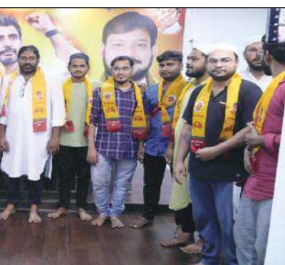
పలువురు జనసేన నాయకులను కూడా కలిశారు.