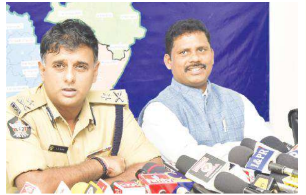
ఎన్నికల ప్రవర్తనా నియమావళిని