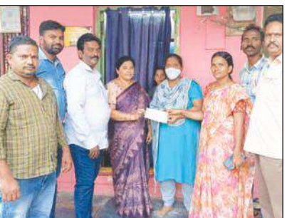
మచిలీపట్నం, మేజర్స్టూస్ : స్థానిక బలరాముని పేట ఏరియాలో నివసిస్తున్న ఒక మహిళ తీవ్రమైన జబ్బి సిండ్రోమ్(ఎముకలు-నరాలు) వ్యాధితో