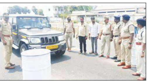
ఎన్నికల పూర్తి అయ్యేవరకు 24 గంటలు వాహనాలు తనిఖీ చేస్తామని డిఎస్పి తెలిపారు.