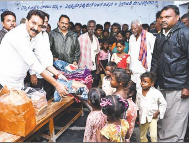
రాష్ట్ర అభివృద్ధి జనసేన, టీడీపీతోనే సాధ్యం