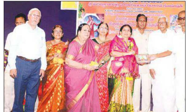
గుంటూరు (సాంస్కృతికం) మేజర్ స్కూల్స్ : స్థానిక బృందావన గార్డెన్స్ శ్రీ వేంకటేశ్వరస్వామి దేవాలయం ఆలయప్రాంగణం అన్నమయ్య కళావేదికపై