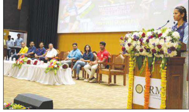
విశేష ప్రతిభ కనబరిచిన ఎస్ఆర్ఎం....