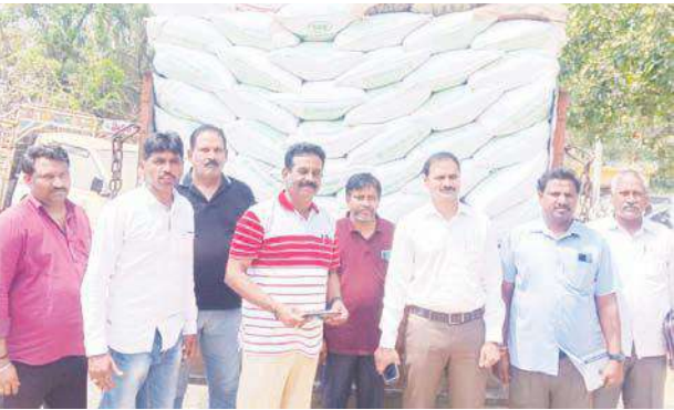
కృష్ణపట్నం పోర్టుకు తరలిపోతున్న బియ్యం మంగళగిరి వద్ద లాలీనీ పట్టుకున్న అధికారులు

గుంటూరు జిల్లా నేటి దినపత్రిక సూర్య బ్యూరో : సోమవారం ఉదయం విజయవాడ వైపు నుండి నెల్లూరు కృష్ణపట్నం పోర్టుకు నేషనల్ హైవే 2