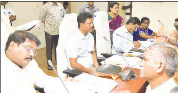
జిల్లాస్థాయి స్పందనలో 108 అర్జీలు నమోదు జిల్లా కలెక్టర్ ఎస్.డిల్లీరావు