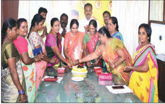
గుంటూరు, మేజర్ న్యూస్ : అంతర్జాతీయ మహిళా దినోత్సవంను పురస్కరించుకొని శుక్రవారం