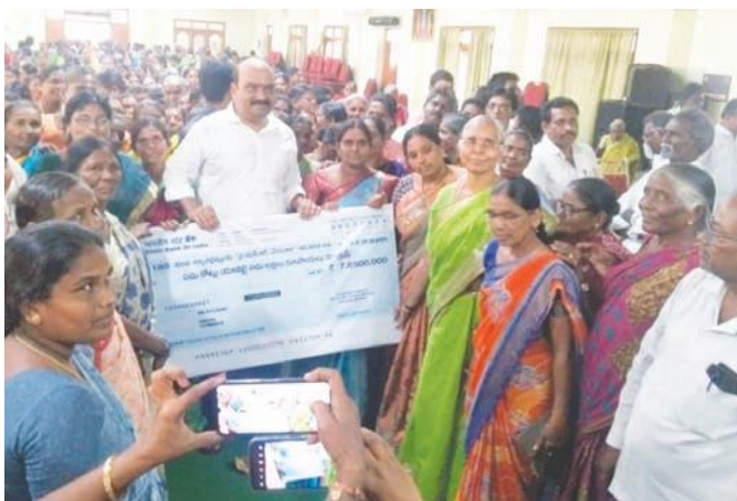
ఎమ్మెల్యే అనిల్ కుమార్