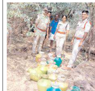
బెల్లం ఊటను ధ్వంసం చేస్తున్న దృశ్యం