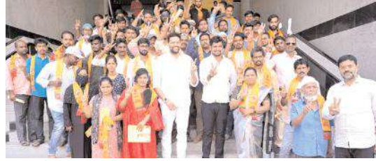
టీడీపీలో చేరిన ముస్లిం యువకులు