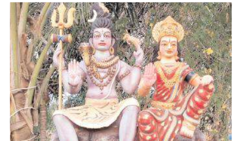
కొండపైన వెలసిన పార్వతి పరమేశ్వరుడు

దుర్యోధన మాయసభ వికపాత్రాభినయం జరుగును. రాత్రి 12 గంటలకు లింగోద్భవ సమయం శ్రీగిరి జ్యోతి దర్శనం జరుగును. అనంతరం అభిషేకాలు నిర్వహిస్తారు. ఈనెల 10న స్వామివారికి పంచమృతాభిషేకం, రథోత్సవం నిర్వహిస్తున్నట్లు ఆలయ నిర్వాహకులు తెలిపారు. మూడు రోజుల పాటు జరిగే ఉత్సవాలకు అలయాలు విద్యుత్ దీపాలతో శోభాయమానంగా ముస్తాబు చేస్తున్నారు.