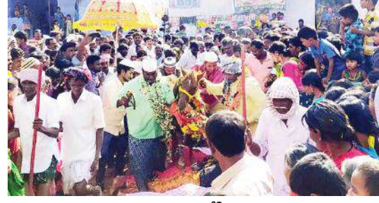
స్వామివారి ఆశ్వాస్తి ఉరేగిస్తున్న భక్తులు

గోనెగండ్ల, మేజర్ న్యూస్ : మండలపరిధిలోని హెన్రీ కైరవాడి గ్రామంలో వెలసిన అల్లిసాహెబ్ స్వామి ఉరుసు మంగళవారం అంగరంగవైభవంగా జరిగింది. వేలాది సంఖ్యలో భక్తులు పాల్గొని స్వామివారికి ప్రత్యేక పూజలు నిర్వహించారు. హెన్రీ కైరవాడి గ్రామస్థులే కాక కర్నూలు, బళ్లారి, మహబూబ్ నగర్, ఆదోని ప్రాంతాల నుంచి పెద్ద సంఖ్యలో భక్తులు ఉరుసు మహోత్సవంకు హాజరయ్యారు. స్వామివారి జీవనమాధిని దర్శించి మొక్కులు తీర్చుకున్నారు. వందలాది మంది భక్తులు తమ కొర్రెలను తీర్చాలని భక్తులు స్వామికి ఇష్టమైన ఇసుకను ఎద్దుల బండ్లు, ట్రాక్టర్లతో సమర్పించి తమ కొర్రెలను తీర్చాలని వేడుకున్నారు. సాయంత్రం గ్రామంలో రేలారేలారే. ఉచిత నాటకప్రదర్శన నిర్వహించారు. అనంతరం పలు రాజకీయ పార్టీల నాయకులు స్వామి వారికి మొక్కులు తీర్చుకున్నారు. ఈ ఏడాది ప్రజలు రైతులు సుఖ సంతోషాలతో ఉండాలని పూజలు నిర్వహించారు. కొర్రెలు తీరిన భక్తులు పెద్ద ఎత్తున స్వామికి ఇష్టమైన ఇసు