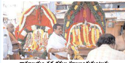
రామాలయం వద్ద భక్తుల పూజలందుకుంటున్న శ్రీబ్రహ్మానందిశ్వరస్వామి సహిత శ్రీమహానందిశ్వర స్వామి వార్లు

నంద్యాల కల్చరల్, మేజర్ న్యూస్ : దాదాపు కొన్ని వందల సంవత్సరాల నుంచి ఆనవాయితీలో భాగంగా మహాపూజ్యశ్రీశ్రీమైన మహానందిలో శ్రీమహాశివరాత్రి ఉత్సవాల అనంతరం శ్రీకామేశ్వరీ సహిత శ్రీమహానందిశ్వరుల కల్యాణోత్సవం అత్యంత వైభవంగా నిర్వహిస్తారు. ఇందులో భాగంగా శ్రీకామేశ్వరీ