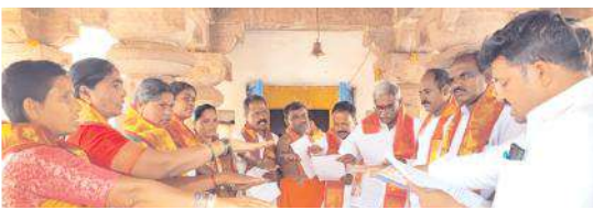
ప్రమాణ స్వీకారం చేస్తున్న నూతన ఆలయ కమిటీ సభ్యులు