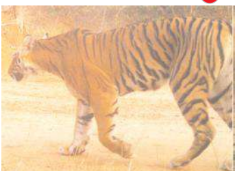
ఉచ్చులో చిక్కుకొని బయటపడ్డ పెద్దపులి