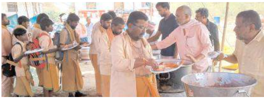
పాపయాత్రకులకు అన్నదానం నిర్వహిస్తున్న దృశ్యం

- వైద్య శివరాల ద్వారా భక్తులకు ఉచితంగా మందులు