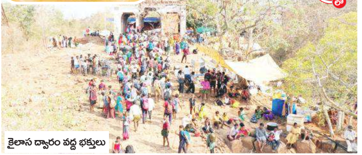
కైలాస ద్వారం వద్ద భక్తులు