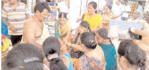
స్వామివార్లకు కాయకర్పారం సమర్పించుకుంటున్న భక్తులు