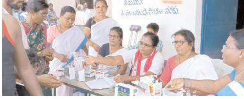
ఉచిత వైద్యశివరాల ద్వారా భక్తులకు వైద్య సేవలందిస్తున్న దృశ్యం

అన్నదానం నిర్వహిస్తున్నారు. నవభారత్ ఫర్టిలైజర్, ఎల్ఎల్పి కంపెనీ ఆధ్వర్యంలో మజ్జిగ, తాగునీటిని