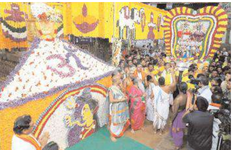
స్వామి అమ్మవార్లకు గ్రామోత్సవం నిర్వహిస్తున్న దృశ్యం