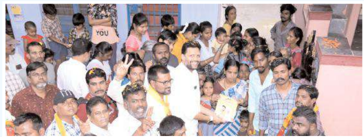
మాట్లాడుతున్న టీజీ భరత్