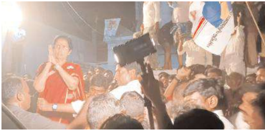
ప్రజలకు అభివృద్ధి చేస్తున్న భువనేశ్వరి