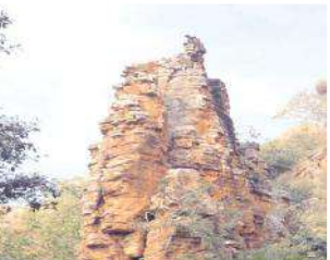
గృహలు సహజ నిధంగా ఏర్పడ్డాయి.

తుందిని నమ్మకం, యాగంటి క్షేత్రంలో ప్రతి ఏటా శివరాత్రి, కార్తీకమాస ఉత్సవాలకు కర్నూలు జిల్లానుండి గాక ఇతర రాష్ట్రాల నుంచి భక్తులు వేలాదిగా తరలివస్తుంటారు. స్వామికి ఎదురుగా ఆలయ ప్రాంగణంలో ఉన్న బసవన్న పెరుగుతున్నట్లు చెబుతారు. ఆలయ నిర్మాణం శిల్పకళా వైభవం పలు ఆశ్చర్యాలకు గురి చేస్తూ కోనేటి స్నానం భక్తులను ఆనందసాగరంలో ముంచెత్తుతాయి. యాగంటి పుణ్యక్షేత్రం సమీపంలోని కొండ