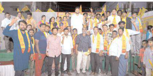
టీడీపీలో చేరిన యువకులు

కర్నూలు, మేజర్ న్యూస్ ప్రతినిధి: కర్నూలు ప్రజలందరూ ఈ ఐదేళ్ల