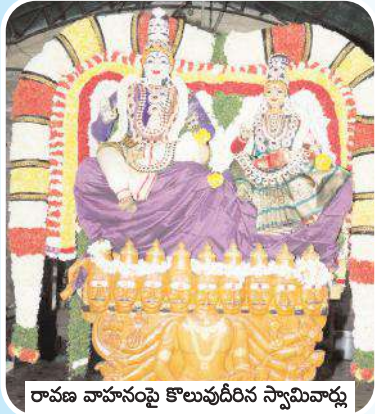
రావణ వాహనంపై కొలువుదీరిన స్వామివార్లు

మహానంది, మేజర్ న్యూస్: మహానంది పుణ్యక్షేత్రంలో మహాశివరాత్రి బ్రహ్మాత్మవాల లో భాగంగా రెండవరోజు శ్రీ కామేశ్వరీ సమేత మహానంది శ్వర స్వామివార్లు సూర్యప్రభ, రావణ వాహనాలపై ఆలయ పురవీధులలో విహరించారు. గురువారం ఉత్సవాలలో భాగంగా మూల విరాళాలు అయిన శ్రీ కామేశ్వరీ సమేత మహానందిశ్వరుల స్వామివార్లకు విశేష ద్రవ్య అభిషేకార్చనలు నిర్వహించారు.