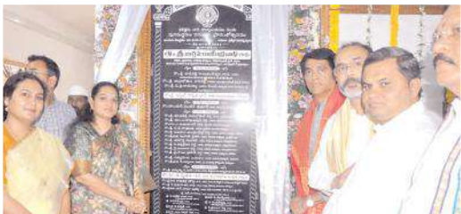
ప్రారంభిస్తున్న ఆర్థిక శాఖ మంత్రి బుగ్గన రాజేంద్రనాథ్

కర్నూలు, మేజర్ న్యూస్ ప్రతినిధి: రాష్ట్రంలోనే కర్నూలు కలెక్టరేట్ కార్యాలయాన్ని భవనాన్ని ఉత్తమంగా ఉండేలా తీర్చిదిద్దుతామని రాష్ట్ర ఆర్థిక, ప్రణాళిక, శాసనసభ వ్యవహారాలు, వాణిజ్య పన్నుల వైపునాభివృద్ధి, శిక్షణ శాఖ మంత్రి, జిల్లా ఇన్చార్జ్ మంత్రి బుగ్గన రాజేంద్రనాథ్ రెడ్డి పేర్కొన్నారు. కలెక్టరేట్ భవన మరమ్మతుల నిమిత్తం రాష్ట్ర ప్రభుత్వం మంజూరు చేసిన రూ. 8కోట్ల వ్యయంతో పునరుద్ధరించిన కర్నూలు కలెక్టరేట్