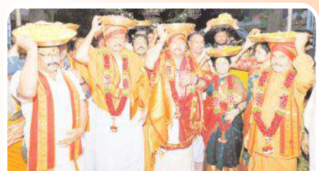
రాష్ట్ర ప్రభుత్వం తరఫున పట్టుచస్త్రాలు సమర్పిస్తున్న దృశ్యం