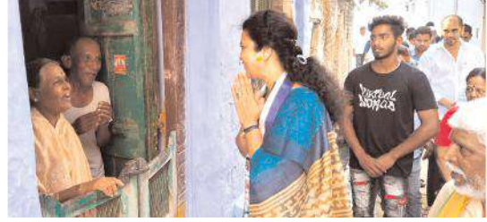
ప్రచారం చేపడుతున్న బుట్టా

కొత్తపల్లి, మేజర్ న్యూస్: మహా శివరాత్రి పర్వదినంను పురస్కరించుకొని ప్రముఖ పుణ్యక్షేత్రమైన కొలనుభారతి క్షేత్రంలో శుక్రవారం నుంచి రెండు రోజులపాటు శాలివాహన అన్నదాన సత్రం ఆధ్వర్యంలో ఉచిత అన్నదాన కార్యక్రమంను నిర్వహిస్తున్నట్లు శాలివాహన అన్నదాన సత్రం సంఘం సభ్యులు గురువారం