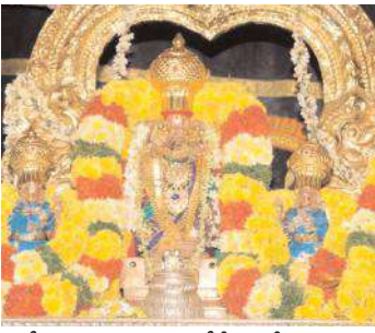
శ్రీ జ్యాల నరసింహ స్వామి, శ్రీదేవ, భాదేవి అమ్మవార్లు