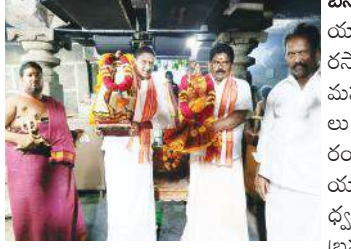
ఉత్సవ విగ్రహాలతో ఈ.వో, శైల్యం

బనగానపల్లెమేజర్, న్యూస్: యాగంట్ల శ్రీ ఉమామహేశ్వరస్వామి దేవస్థానం నందు మహాశివరాత్రి బ్రహ్మాత్మ వాలు గురువారం నుండి అంగరంగ వైభవంగా ప్రారంభమయ్యాయి. మొదటిరోజు ధ్వజోహారణంతో ఈ బ్రహ్మాత్మ వాలను ప్రారంభించడం జరిగింది. ఆలయ