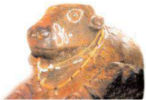
అంతకంతకు పెరుగుతున్న నందివిగ్రహం

గృహలో కాలజ్ఞానాన్ని లభించినట్లు ఆధారలు ఉన్నాయి. యాగంటి పుష్కరిణిలోకి నందినోటి నుండి నీరు ఎల్లవేళల ప్రవహించడం ఇక్కడి విషేషం ఈ పుష్కరిణిలో స్నానం ఆచరిస్తే పాపాలు హరించి పుణ్యం కలుగు