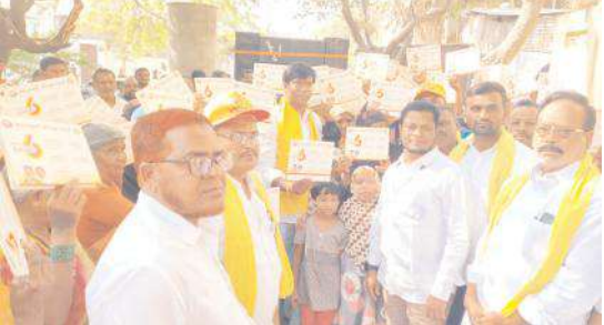
కరవత్రాలు పంపిణీ చేస్తున్న మాజీ ఎమ్మెల్యే బీసీ

బాబు ష్యూరిటీ భవిష్యత్తుకు గ్యారంటీ కార్యక్రమంలో మాజీ ఎమ్మెల్యే బీసీ ప్రచారం