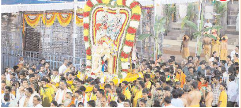
భక్తుల నడుమ గజ వాహనంపై ఊరేగిన శ్రీశైలేశుడు