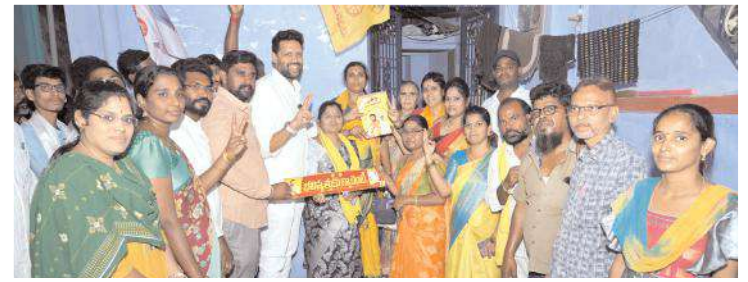
ప్రజలతో మాట్లాడుతున్న టీజీ భరత్