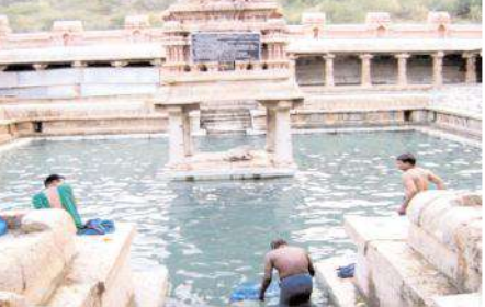
కోనేరు (పెద్ద పుష్కరిణి)

జరిగిందని ఆకాశదీప విశిష్టతను అర్చకులు తెలిపారు. అదే విధంగా పూర్వం అగస్త్యముని యాగంటి క్షేత్రం నందు తపస్సు చేసుకుంటు ఉండగా రాకాసుడు అనే రాక్షసుడు పచ్చి (కాకి) కావుకావు అని అరవడం వలన అగస్త్య మహాముని తపస్సుకు భంగం వాటిల్లడంతో కోపోద్ఘాటమైన కాకాసురిడికి శాపం వశిగను ఆనాటి శాపంచేతనే నేటి వరకు యాగంటి క్షేత్ర పరిసర ప్రాంతాలలో కాకి (శనిశ్వరుడికి ప్రవేశం లేదని) అర్చకులు తెలిపారు. ఆకాశదీపాన్ని వెలిగిస్తే సకల శనిదోషాలు తొలగిపోయి సకల శుభాలు కలుగుతాయని అర్చకులు తెలిపారు. యాగంటి క్షేత్రం తరలివచ్చే భక్తుల కోసం శ్రీ ఉమామహేశ్వర నిత్యాన్నదాన సత్రం, ఆర్యవైశ్య అన్న సత్రం, రెడ్ల సత్రం, బ్రాహ్మణ, వీరశైవ లింగాయత్ సత్రాలలో భక్తులకు నిత్యం అన్నదాన కార్యక్రమం నిర్వహిస్తుంటారు.