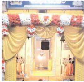
శ్రీకాశీవిశ్వేశ్వర స్వామి గర్భగుడి అలంకరణ

నంద్యాల కలెక్టర్, మేజర్ న్యూస్ : మహాశివరాత్రి పురస్కరించుకుని నంద్యాల పట్టణంలోని శివాలయాలు అత్యంత సుందరంగా ముస్తాబయ్యాయి. శుక్రవారం మహాశివరాత్రి రోజు ఉదయం తెల్లవారుజామున స్వామి వార్లకు అభిషేకాలు, బిల్వపత్రాలతో అర్చన, జలాభిషేకం అనంతరం రాత్రి లింగోద్భవ కాలం 12గంటలకు స్వామివారికి ఎంతో వైభవంగా నమక చమక ద్రావిడిపిక నిర్వహించిన అనంతరం స్వామి అమ్మవార్లు కల్యాణానికి బయలుదేరుతారు. పట్టణంలోని సంజీవనగర్ రామాలయంలో వెలసిన శ్రీకాశీవిశ్వేశ్వర స్వామి, శ్రీనాగలింగేశ్వరస్వామి, శ్రీ బ్రహ్మానందేశ్వరస్వామి ఆలయం, సోమనంది, నాగనంది, శ్రీప్రభుమనంది ఆలయాల్లో ప్రత్యేక ఏర్పాట్లు చేశారు. భక్తులకు ఎలాంటి ఇబ్బందులు కలగకుండా క్యూ లైన్లు ఏర్పాటు చేశారు. రాత్రి జరిగే కల్యాణానికి మహానంది క్షేత్రానికి ఆర్డీసి అధికారులు ప్రత్యేక బస్సులు ఏర్పాటు చేశారు.