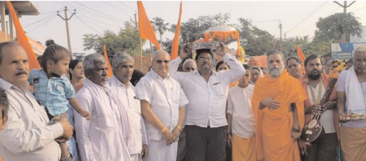
అందుకుంటూ వారం రోజుల తర్వాత శ్రీ దత్తగిరి మహారాజ్ ఆశ్రమానికి చేరుకుంటుందని తెలిపారు. ఈ కార్యక్రమంలో టోరంచ, సిందోల్ తదితర గ్రామాల భక్తులు పాల్గొన్నారు.