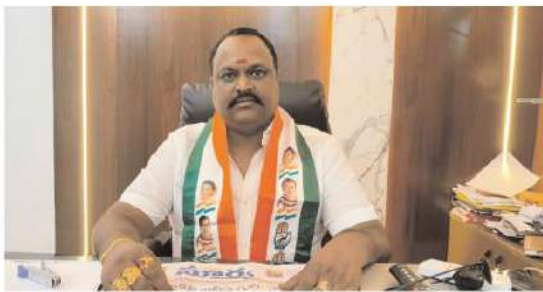
విచారణ జరిపి కబ్బాలకు పాల్పడిన వ్యక్తి పై కఠిన చర్యలు తీసుకుని ఆసాని కుంట పరిరక్షించాలని ఆయన కోరారు.