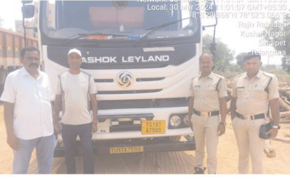
వారి పేర్లను గోప్యంగా ఉంచుతామని అధికారులు ఒక ప్రకటనలో తెలిపారు.

సిద్దిపేట ప్రతినీధి, మేజర్ న్యూస్ : లారీలో ఎలాంటి వే బిల్, ప్రభుత్వ అనుమతి లేకుండా భూపాలపల్లి నుండి హైదరాబాద్ వెళ్ళుచుండగా మార్గమధ్యన 3 టాన్ పోలీస్ స్టేషన్ పరిధిలోని తెలంగాణ ధర్మకాంట పద్ద లారీ నంబర్ టి ఎస్ 19 టి ఏ చి 7500 ఉన్నదని నమ్మదగిన సమాచారంపై సిద్దిపేట టాన్స్ ఫోర్స్ పోలీస్ అధికారులు, శ్రీ టాన్ పోలీసులు వెళ్లి శనివారం రోజున లారీని పట్టుకున్నారు. ఈ సందర్భంగా టాన్స్ ఫోర్స్ అధికారులు మాట్లాడుతూ ఎలాంటి ప్రభుత్వ అనుమతి లేకుండా ఇసుక, పిడిఎస్ రైస్, అక్రమ రవాణా చేసిన మరియు పేకాట, జూదం, గంజాయి ఇతర మత్తు పదార్థాలు విక్రయించిన కలిగి ఉన్న చట్ట వ్యతిరేక కార్యక్రమాలకు పాల్పడుతున్నట్లు సమాచారం ఉంటే వెంటనే సిద్దిపేట టాన్స్ ఫోర్స్ ఆఫీసర్స్ 8712667445, 8712667446, 8712667447, నెంబర్లకు సమాచారం అందించాలని కోరారు. సమాచారం అందించిన