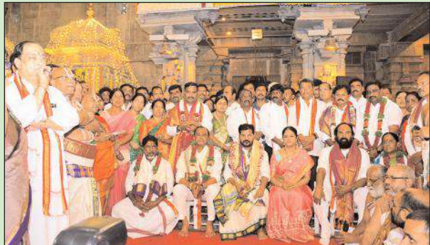
యాదగిరి కొండ, మేజర్ న్యూస్ : స్వస్తి శోభకృత్ నామ సంవత్సర ఫాల్గుణ శుద్ధ పాడ్యమి సోమవారం నుండి ఫాల్గుణ శుద్ధ ద్వాదశి గురువారం తేది : 21.03.2024 వరకు శ్రీ స్వామి వారి వార్షిక బ్రహ్మోత్సవములు అత్యంత