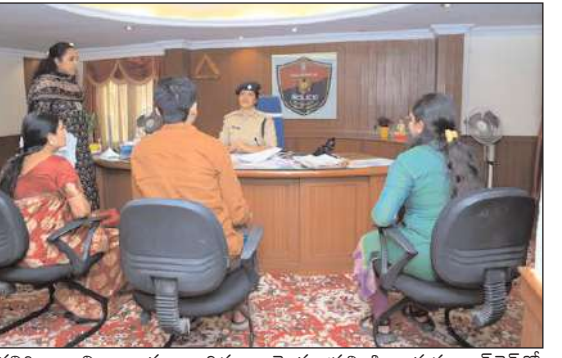
కలిగించాలని అన్నారు. బాధితుల యొక్క ప్రతి ఫిర్యాదును ఆన్ లైన్ లో పొందుపరుస్తూ నిత్యం పర్యవేక్షణ చేస్తున్నట్లు తెలిపారు.

నల్గొండ జిల్లా బ్యూరో ప్రతి సోమవారం ప్రజల సౌకర్యార్థం నిర్వహించే గ్రీవెన్స్ లో భాగంగా ఈ రోజు జిల్లా పోలీసు కార్యాలయంలో జిల్లాలోని వివిధ ప్రాంతాల నుండి వచ్చిన దాదాపు 40 మంది అర్జీదారులతో నేరుగా మాట్లాడి తమ సమస్యలను తెలుసుకొని సంబంధిత అధికారులతో పోలీస్ మాట్లాడి పూర్తి వివరాలు సమర్పించాలని ఆదేశించారు. ఈ రోజు వచ్చిన ఫిర్యాదులు భూ సమస్యలు, భార్యభర్తల మధ్య విభేదాలు, ఫైనాన్స్ సమస్యలపై ఫిర్యాదులు రావడం జరిగిందని తెలిపారు. ఈ సందర్భంగా మాట్లాడుతూ ప్రజలకు పోలీస్ శాఖను మరింత చేరువ చేయడం లక్ష్యంగా ప్రజా సమస్యలను పరిష్కరించే విధంగా కృషి చేస్తున్నామని అన్నారు. పోలీస్ స్టేషన్ కి వచ్చిన ఫిర్యాదుదారులతో మర్యాదగా మాట్లాడి వినతులు స్వీకరించి సంబంధిత ఫిర్యాదులపై క్షేత్రస్థాయిలో పరిశీలించి వేగంగా స్పందించి బాధితులకు న్యాయం జరిగేవిధంగా చూడాలని, ఫిర్యాదుదారునికే భరోసా, సమ్మతం