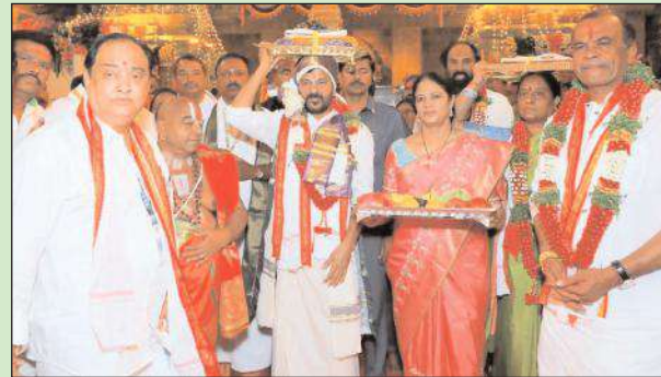
వైభవముగా నిర్వహించబడుచున్నవి. బ్రహ్మోత్సవములలో భాగంగా సోమవారం ఉదయం శ్రీ స్వామి వారి ఆలయములో నిత్యారాధనల అనంతరము శ్రీ విష్ణుకృష్ణ ఆరాధన, స్వస్తివాచనం, రక్షాబంధన కార్యక్రమములు శ్రీ పాంచరాత్ర ఆగమ