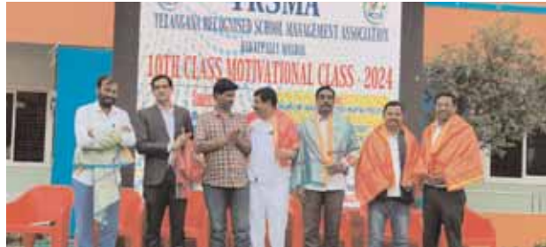
కూకట్ పల్లి, మేజర్ న్యూస్: ఆధ్వర్యంలో పల్లవి మోడల్ హైస్కూల్లో పదవ తరగతి