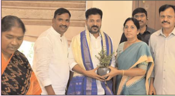
భువనగిరి మేజర్ న్యూస్ తెలంగాణ రాష్ట్ర ముఖ్యమంత్రి రేవంత్ రెడ్డిని రాష్ట్ర మహిళా సహకార అభివృద్ధి సంస్థ కార్పొరేషన్ చైర్మన్ బండ్రు శోభారాణి ప్రభుత్వ వివేక మరియు అతరు ఎమ్మెల్యే బీర్ల బలయ్యతో కలిసి కలసినారు.