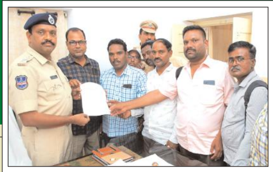
టియడబ్యూజై (ఐజెయూ) ఆధ్వర్యంలో