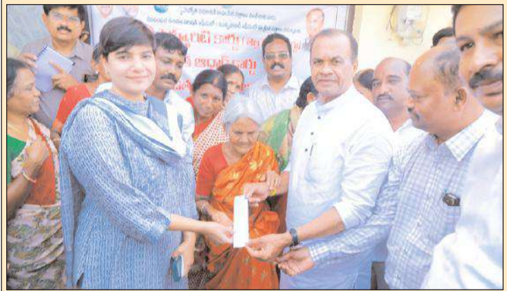
నల్గొండ జిల్లా బ్యూరో