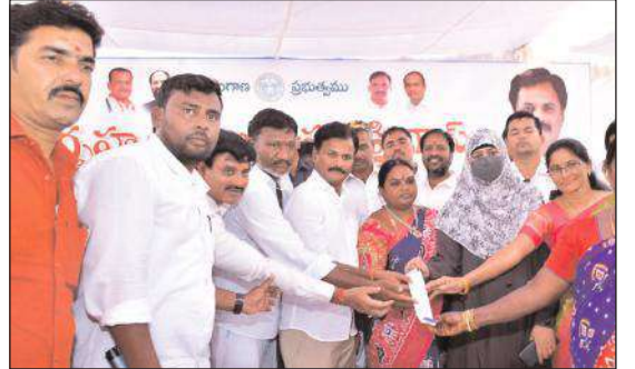
నిర్వహించినామని, అధికారంలోకి వస్తే పేదలకు ఇండ్లు కట్టుకోవడానికి ఇంటి జాగ్రత్త పాటు ఐదు లక్షలు ఇస్తామని చెప్పినామని, మిగతా 2లో

భువనగిరి మేజర్ న్యూస్-మా భాధ్యతగా మా మాటగా ఎన్నికల ముందు ప్రజలకు ఇచ్చిన "ఆరు గ్యారంటీ" పథకాలను 100 రోజులలోనే పూర్తి చేస్తున్నామని భువనగిరి ఎమ్మెల్యే కుంభం అనిల్ కుమార్ రెడ్డి తెల్పారు. ఆదివారం భువనగిరి పట్టణంలోని అర్చన కాలనీలో ఏర్పాటు చేసిన కార్యక్రమంలో పాల్గొని మాటలాడుతూ "ఆరు గ్యారంటీ" పథకాలలో భాగంగా ఉచిత కరెంట్ పథకంను ప్రజలకు అందజేసారు. ఈ సందర్భంగా మాటలాడుతు కాంగ్రెస్ పార్టీ మాట ఇస్తే నిలుపుకుంటుందని, అనాడు ప్రభుత్వంలో లేనప్పుడు ప్రజలతోనే ఉంటు, ప్రజా సమస్యలపైన పోరాటాలను