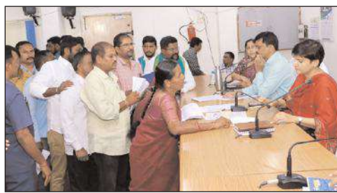
నల్గొండ జిల్లా బ్యూరో

ప్రజావాణి కార్యక్రమంలో భాగంగా సోమవారం ఆమె జిల్లా కలెక్టర్ కార్యాలయంలోని సమావేశ మందిరంలో ప్రజల వద్ద నుండి ఆర్డీలను స్వీకరించారు. ఆర్డీల స్వీకరణ అనంతరం ఆమె జిల్లా అధికారులతో మాట్లాడుతూ ఎప్పటి ఫిర్యాదులు అప్పుడే పరిష్కరించాలని సూచించారు. దానివల్ల దరఖాస్తుదారులకు మేలు జరుగుతుందని అన్నారు. ముఖ్యంగా నిర్దేశించిన సమయంలో పరిష్కరించాల్సిన ఆర్డీలకు ప్రాధాన్యత ఇచ్చి వాటి పరిష్కారం పై ప్రత్యేక శ్రద్ధ వహించాలని అన్నారు. జిల్లా స్టాయిత్ పాటు కిందిస్థాయి అధికారులు సైతం ఫిర్యాదుల పరిష్కారంలో చొరవ