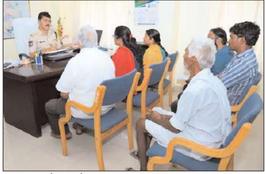
నల్గొండ జిల్లా బ్యూరో

ప్రతి సోమవారం ప్రజల సౌకర్యార్థం నిర్వహించే గ్రీవెన్స్ డేలో భాగంగా ఈ రోజు జిల్లా పోలీసు కార్యాలయంలో జిల్లాలోని వివిధ ప్రాంతాల నుండి వచ్చిన దాదాపు 41 మంది అర్జీదారులతో నేరుగా మాట్లాడి వారి సమస్యలను తెలుసుకొని సంబంధిత అధికారులతో ఫోన్లో మాట్లాడి పూర్తి వివరాలు సమర్పించి తగు చర్యలు తీసుకోవాలని ఆదేశించారు. ఈ రోజు వచ్చిన ఫిర్యాదులు భూ సమస్యలు, వృద్ధులు, భార్య భర్తల మధ్య విభేదాలు, ఫైనాన్స్ సమస్యల పైన ఫిర్యాదులు రావడం జరిగిందని తెలిపారు. ఈ సందర్భంగా మాట్లాడుతూ తెలంగాణ రాష్ట్ర ప్రభుత్వం ప్రజావాణిలో ప్రజా సమస్యల పట్ల అధిక ప్రాధాన్యత ఇస్తూ బాధితుల ప్రతి సమస్యకు స్పందిస్తూ పరిష్కరించే విధంగా కృషి చేయాలని ఆదేశాలతో, ప్రజలకు పోలీస్ శాఖను మరింత చేరువ చేయడం లక్ష్యంగా కృషి చేస్తున్నామని అన్నారు. బాధితుల యొక్క ప్రతి ఫిర్యాదును ఆన్లైన్లో పొందుపరుస్తూ నిత్యం పర్యవేక్షణ చేస్తూ తగు చర్యలు తీసుకోవడం జరుగుతుందని తెలిపారు.