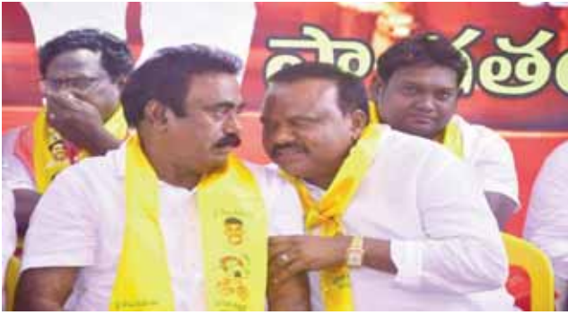
హోరైత్తిన అరుంధతి వాడ