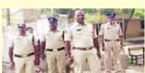
ఆత్మకూరు,మేజర్ న్యూస్: ఆత్మకూరులో శుక్రవారం ఇంటర్మీడియట్ ప్రథమ సంవత్సర విద్యార్థులకు పబ్లిక్ పరిక్షలు ప్రారంభం కాగా ఎలాంటి