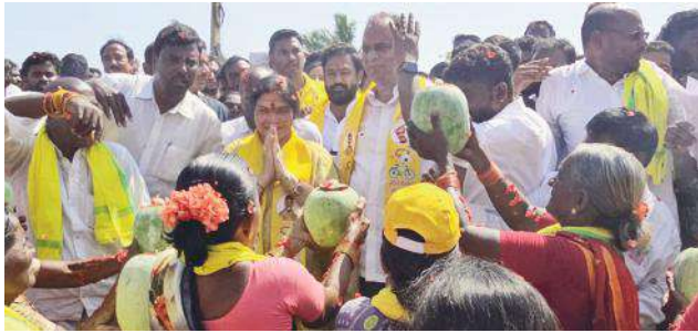
- తొలి అడుగు.. అద్వితీయం.