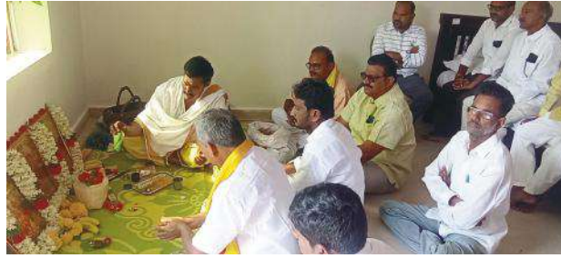
-ఆత్మకూరులో "ఆనం" విజయం తద్దం