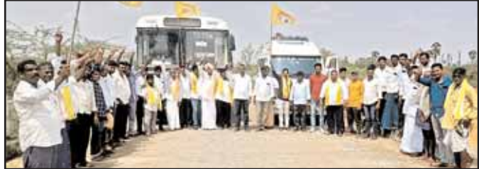
మన చంద్రబాబు నాయుడుకి గిట్టగా ఇస్తామని అన్నారు. ఈ కార్యక్రమంలో మండల నాయకులు, కార్యకర్తలు, అభిమానులు పాల్గొన్నారు.