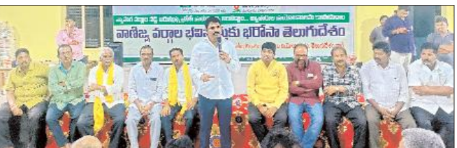
విధానాలు అసమర్థ నిర్ణయాలతో, రాజకీయ వేధింపులతో వ్యాపార రంగం కుప్పకూలిందన్నారు. పరిశ్రమలను ప్రోత్సహించాల్సిన ప్రభుత్వం పన్నుల భారం వేస్తూ పరిశ్రమలను మూత దిశగా వేధింపులకు గురిచేసిందన్నారు. రాష్ట్రంలో అనేక మిగతా 3లో