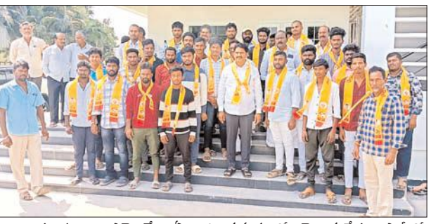
చెందిన పలు ఎమ్మెల్యే ఏలూరి సమక్షంలో తెలుగుదేశం పార్టీలో చేరారు. ఈ సందర్భంగా మిగతా 3లో

పర్చూరు, మేజర్ న్యూస్: భవిష్యత్తుకు తెలుగుదేశం పార్టీ అధినేత చంద్రబాబు ముఖ్యమంత్రి కావడం అవశ్యమని, ప్రజలంతా ఏకతాటి పైకి వచ్చి మద్దతు తెలపాలి సమయం ఆసన్నమైందని తెలుగుదేశం పార్టీ బాపట్ల పార్లమెంటు అధ్యక్షులు, ఎమ్మెల్యే ఏలూరి సాంబశివరావు అన్నారు. శనివారం ఎమ్మెల్యే ఏలూరి క్యాంప్ కార్యాలయంలో పర్చూరు నియోజకవర్గానికి చెందిన పలు గ్రామాలకు చెందిన వైసిపి నాయకులు కార్యకర్తలు