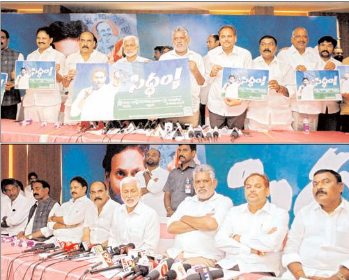
నెల్లూరు, బాపట్ల, గుంటూరు, ప్రకాశం, అసెంబ్లీ నియోజకవర్గాల నుంచి 15 పల్నాడు జిల్లాల పరిధిలోని మొత్తం 43 లక్షల మంది హాజరు కానున్నట్లు

మేదరమెట్ల వద్ద 10న జరిగే సభను విజయవంతం చేయాలి మీడియాతో లీజనల్ కోఆర్డినేటర్ విజయసాయిరెడ్డి పిలుపు