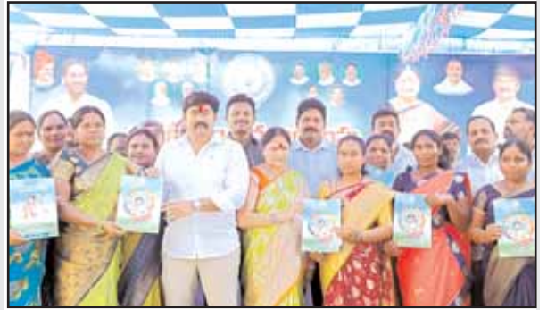
దక్కతుంది అని అన్నారు. రాష్ట్రం లో ని ప్రతి గ్రామం లో పేదల కు ఇంటి స్థలాలు ను ఏర్పాటు చేసి గృహాల ను ఏర్పాటు చేసింది వైకాపానే నని అన్నారు.