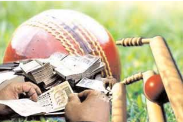
క్రికెట్ బెట్టింగ్ నిర్వహించే నిర్వాహకులు ముఖ్యంగా యువతను టార్గెట్ చేస్తున్నారు. ఇంటర్, డిగ్రీ, బీటెక్ ఇలా ఉన్నత విద్య అభ్యసిస్తున్న చాలా మంది