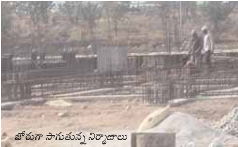
జోరుగా సాగుతున్న నిర్మాణాలు

భారీస్థాయిలో జరుగుతున్న ఈ తతంగంపై ఒక్కొక్కరుగా స్పందిస్తున్న స్థానికులను, అధికారులను తమదైన శైలిలో మచ్చిక చేసుకుంటున్నారు. తాము చేస్తున్న ఈ అక్రమ దందాను పరిశీలించేందుకు వస్తున్నదే వ్యర్థ అనే విషయాన్ని ఎప్పటికప్పుడు తెలుసుకునేందుకు రియల్టర్లు సీసీ కెమెరాలు ఏర్పాటు చేసుకొని పర్యవేక్షిస్తున్నారు. ప్రభుత్వ ఆదాయానికి భారీగా గండి కొట్టడమే కాకుండా... ప్రభుత్వ భూమిని కాజేసే కుట్రలో అందర్నీ భాగస్వాములను చేయాలనే నిర్వహకులు