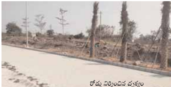
రోడ్డు నిర్మించిన దృశ్యం