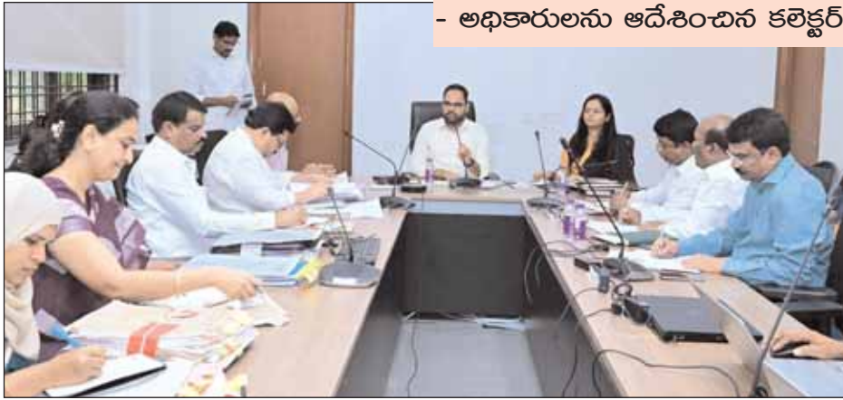
- అధికారులను ఆదేశించిన కలెక్టర్