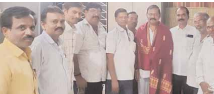
ఎమ్మెల్యేని సన్మానిస్తున్న వీరశైవ లింగాయత్ నాయకులు. కుల్చుచర్ల రూరల్, మేజర్ న్యూస్ (మార్చి 07): వీరశైవ లింగాయత్ లింగ బలిజ సంఘం కుల్చుచర్ల

● ఎమ్మెల్యే రామ్మోహన్ రెడ్డిని కలిసిన మండల వీరశైవ లింగాయత్ నాయకులు