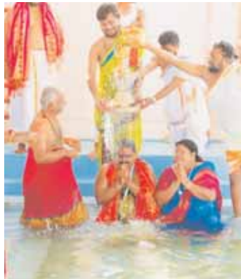
పండితుల మంతోచ్చరణాల మధ్య త్రిశూల స్నానం చేస్తున్న ఆలయ చైర్మన్ దంపతులు.