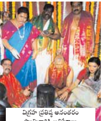
విగ్రహ ప్రతిష్ఠ అనంతరం స్వామివారికి అభిషేకాలు.