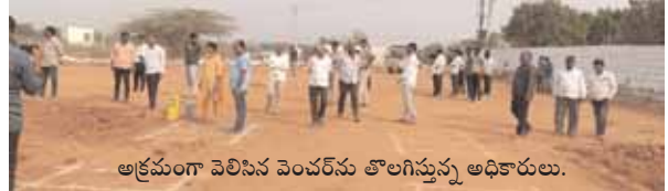
అక్రమంగా వెలసిన వెంచర్ ను తొలగిస్తున్న అధికారులు.