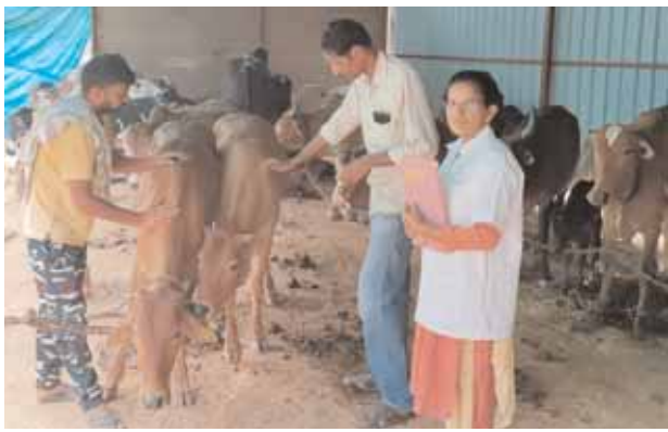
టీకాలు ఇస్తున్న పశు వైద్యులు