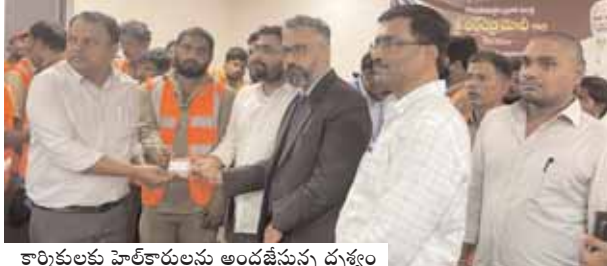
కార్మికులకు హెల్త్ కార్డులను అందజేస్తున్న దృశ్యం