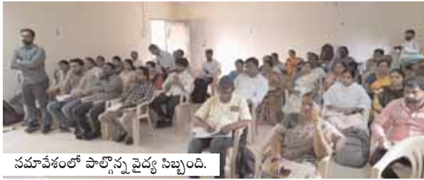
సమావేశంలో పాల్గొన్న వైద్య సిబ్బంది.

లయంలో మాతృ మరణాలు మరియు శిశు మరణాలు గురించి అన్ని ప్రాథమిక ఆరోగ్య కేంద్రాల వైద్యాధికారులు, సూపర్ వైజర్లు, ఆశ లతో రివ్యూ మీటింగ్ నిర్వహించారు. అదే విధంగా జాతీయ కీటక జనిత వ్యాధుల నివారణకు సిబ్బందికి శిక్షణ ఇవ్వడం జరిగింది. ఈ సందర్భంగా ఆయన మాట్లాడుతూ... గర్భ దారణ నుండి ప్రసవం వరకు ఏలాంటి ప్రమాదకర లక్షణాలు కనిపించిన వెంటనే సంబంధిత వైద్యాధికారి రిఫర్ చేయాలని తెలిపారు. అవసరం ఐతే పైస్థాయి