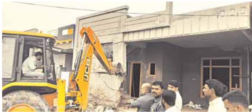
చీర్యల్ గ్రామంలో అక్రమంగా వెలసిన ఇండ్లు

150 మంది పోలీస్ బలగాల మధ్య చీర్యాల రెవెన్యూ పరిధిలోని సర్వే నెం. 221, 222, 334, 335, 337లలో ప్రభుత్వ భూమి చీర్యాల పెద్ద చెరువులోని ఎప్పివల్, బఫర్ జోన్ లో 11 ఇండ్లు, గ్రామ పంచాయతీ పరిషత్ తీసుకోకుండా నిర్మించిన 40 ఇండ్లను, ఔటర్ రింగ్ రోడ్ కు ఆనుకొని ఉన్న సర్వే నెం. 101, 102లలో సూతనంగా ఏర్పాటు వెంచర్ లలో ప్రహారీలను పూర్తిగా నెలమట్టం చేశారు. తెల్లవారు జామున 5 గంటలకు ప్రారంభమైన కూల్చివేతలు 12 గంటల వరకు కొనసాగాయి.