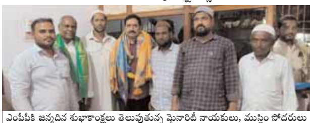
ఎంపీపీ జన్మదిన శుభాకాంక్షలు తెలుపుతున్న మైనారిటీ నాయకులు, ముస్లిం సోదరులు