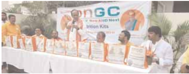
సమావేశంలో మాట్లాడుతున్న కే.లక్ష్మణ్.

- బీజేపీ జాతీయ మోర్చా అధ్యక్షుడు, రాజ్యసభ సభ్యులు డాక్టర్ కే.లక్ష్మణ్