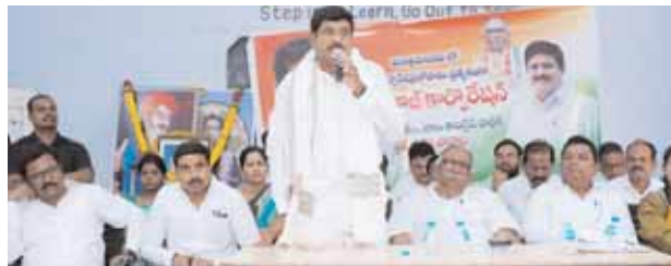
బీసీ సంఘం సమావేశంలో మాట్లాడుతున్న ఎమ్మెల్యే మనోహర్ రెడ్డి

● తాండూరు ఎమ్మెల్యే మనోహర్ రెడ్డి వెల్లడి