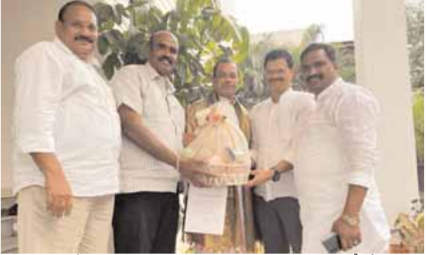
ఆమనగల్లు, మేజర్ స్యూస్ (మార్చి 17) ఆమనగల్లు మున్సిపాలిటీలోని జంగా రెడ్డిపల్లి గ్రామం నుంచి చంద్రాయన పల్లి గ్రామం వరకు అసంపూర్తిగా ఉన్న బీటీ