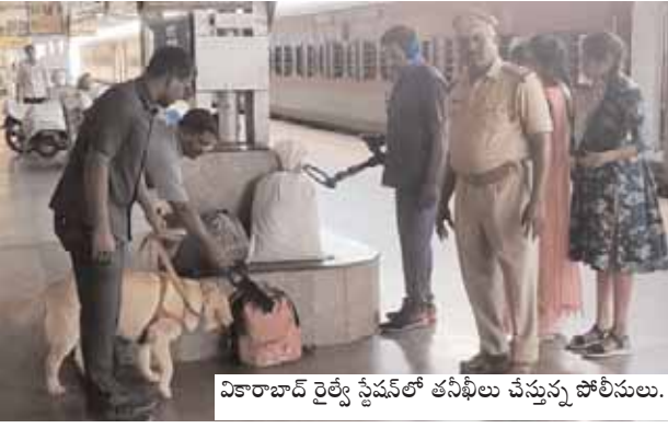
వికారాబాద్ రైల్వే స్టేషన్లో తనిఖీలు చేస్తున్న పోలీసులు.

వికారాబాద్ జిల్లా ప్రతినిధి, మేజర్ న్యూస్ (మార్చి 23): జిల్లా ఎస్సీ సంస్థల కోటి రెడ్డి ఆదేశాల మేరకు జిల్లాలో లోక్ సభ ఎన్నికల దృశ్య శనివారం జిల్లా బిడి టీం అధికారులు వికారాబాద్ పట్టణంలోని రైల్వే స్టేషన్ మరియు బస్ స్టేషన్ లలో ఆకస్మికంగా తనిఖీలు చేశారు. జిల్లాలో ఎక్కడైనా మత్తు పదార్థాలు, పేలుడు పదార్థాలు రవాణా జరుగుతున్నట్లు అనుమానం ఉన్న లేదా దంపలు కల్గి ఉన్నట్లు అనుమానం ఉన్న వెంటనే తమ పరిధిలోని పోలీస్ అధికారులకు గాని డైల్ 100 గాని కాల్ చేసి తెలియజేయాలని ఎస్సీ కోటిరెడ్డి తెలిపారు.