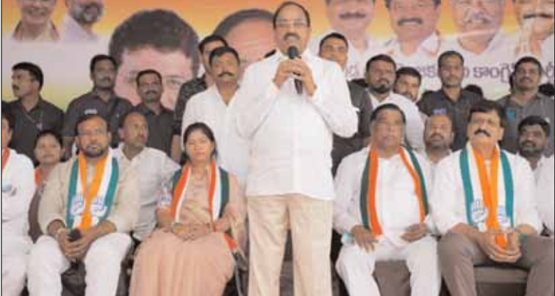
సమావేశంలో మాట్లాడుతున్న రాష్ట్ర మంత్రి, పార్లమెంట్ ఇంచార్జ్ తుమ్మల నాగేశ్వర రావు

మేడ్చల్ జిల్లా ప్రతినిధి/పామిర్ పేట్, మేజర్ న్యూస్ (మార్చి 24): మల్కాజిగిరి పార్లమెంట్ పై కాంగ్రెస్ జెండా ఎగరాలని, మేడ్చల్ గడ్డం కాంగ్రెస్ అడ్డా అని, సీఎం రేపంత్ కు ఈ పార్లమెంటు సీటు ను తిరిగి కానుకగా ఇవ్వాలని రాష్ట్ర వ్యవసాయ శాఖ