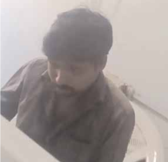
తహసీల్దార్ కార్యాలయంలో పనిచేస్తున్న ప్రైవేటు వ్యక్తి

కొందుర్గు, మేజర్ న్యూస్ (మార్చి 8) : రెవెన్యూ విభాగంలో అవినీతికి తావులేకుండా ఉన్నత అధికారులు, పాలకులు ఓవైపు చర్యలు చేపడుతుంటే మరోవైపు లంచగొండి అధికారులు మాత్రం బుద్ధి మార్చుకోవడం లేదు. అవినీతికి పాల్పడుతున్న అధికారులను ఇక్కడి కార్యాలయంలో ఏసిబి అధికారులు పట్టుకున్న కింది స్థాయి సిబ్బంది మాత్రం తమ వంకర బుద్ధిని పోన్చుకోవడంలేదు. చిన్న చిన్న