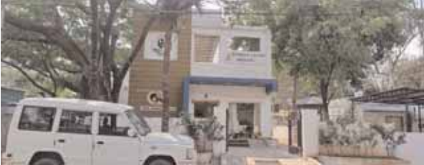
గతంలో సబ్ ఇన్స్పెక్టర్ కేటాయించిన వెంటనే భరోసా సెంటర్ కు కేటాయించిన దృశ్యం