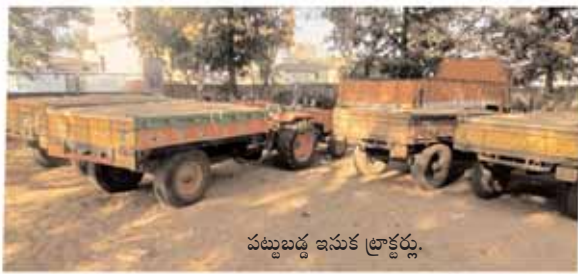
పట్టుబడ్డ ఇసుక ట్రాక్టర్లు.