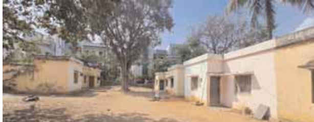
మేడ్చల్ పోలీస్ స్టేషన్లో విధులు నిర్వహిస్తున్న సిబ్బందికి కేటాయించిన నివాస గృహాలు