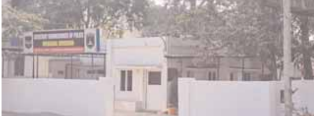
మేడ్చల్ సర్కిల్ ఇన్స్పెక్టర్ కు కేటాయించిన ఇంటిని ఏసీపీ కార్యాలయానికి కేటాయించిన దృశ్యం

మేడ్చల్, మేజర్ న్యూస్ (మార్చి 8) : మేడ్చల్ మల్కాజ్ గిరి మాజీ పార్లమెంట్ సభ్యుడు, తెలంగాణ రాష్ట్ర ముఖ్యమంత్రి ఎనుముల రేవంత్ రెడ్డి తన రాజకీయ ప్రస్థానంలో మేడ్చల్ మల్కాజ్ గిరి జిల్లా రేవంత్ రెడ్డిని రాజకీయంగా నిలబెట్టడంలో మేడ్చల్ జిల్లా ప్రప్రథమంగా నిలిచిందని రాజకీయ విశ్లేషకులు అభిప్రాయం వ్యక్తం చేస్తున్నారు. రేవంత్ రెడ్డి సైతం మేడ్చల్ మల్కాజ్ గిరి జిల్లాకు తనదైన శైలిలో అభివృద్ధి పర్చడంలో ముందుకు తీసుకెళ్లిన చర్యలు గ్రెగోరియన్లు తెలియ వచ్చింది. దీనికి ప్రధాన కారణం మేడ్చల్ జంట నగరాలకు కూతవేటు దూరంలో ఉండడం మేడ్చల్ కాంగ్రెస్ పార్టీ అండగా మేడ్చల్ వాస్తవ్యులు ఆనాటి నుంచి ఈ నాటి వరకు కాంగ్రెస్ పార్టీకి ఓటర్లు మద్దతుగా ఉన్నారు. ఈ నేపథ్యంలో నేడు కండ్లకోయలో పలు అభివృద్ధి పనుల శంకుస్థాపన ప్రారంభోత్సవ కార్యక్రమంలో భాగంగా మేడ్చల్ జిల్లాకు విచ్చేస్తున్న రాష్ట్ర ముఖ్యమంత్రి ఎనుముల రేవంత్ రెడ్డికి మేడ్చల్ ప్రజలు సూర్య దినపత్రిక ద్వారా ముఖంగా విన్నపాలు చేస్తున్నారు. మేడ్చల్ మల్కాజ్ గిరి పేరుతో జిల్లా కలెక్టర్ కార్యాలయాన్ని గతంలో బీఆర్ఎస్ ప్రభుత్వంలో గత ముఖ్యమంత్రి కేసీఆర్ ఆదేశాల మేరకు శామీర్ పేట మండలంలోని అంతాయపల్లి గ్రామంలో ఏర్పాటు చేశారు. అయినప్పటికీ మేడ్చల్ పట్టణంలో జిల్లా కలెక్టర్ సమీకృత కార్యాలయాన్ని ఏర్పాటు చేయాలని తద్వారా మేడ్చల్ అభివృద్ధికి తోడ్పాటును అందించాలని మేడ్చల్ ప్రజలు అభిప్రాయం వ్యక్తం చేస్తున్నారు.