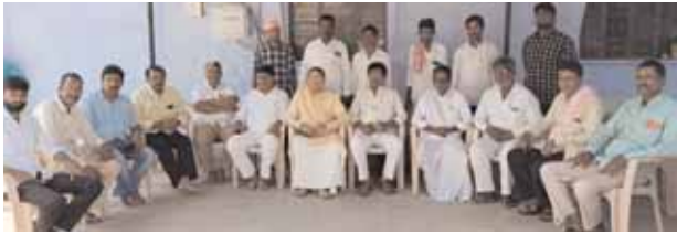
విలేకర్ల సమావేశంలో మాట్లాడుతున్న నాయకులు.