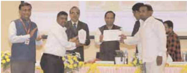
ప్రశంసపత్రం అందుకుంటున్న డాబా యాజమాన్యం.

వికారాబాద్ జిల్లా ప్రతినిధి, మేజర్ న్యూస్ (మార్చి 09): ఆహ్లాదకరమైన వాతావరణం, పచ్చని గడ్డి, పరిశుభ్రతతో పాటు నాణ్యమైన భోజనం అందిస్తున్నందుకు జాతీయ స్థాయిలో ఉత్తమ పత్రం అందుకున్నారు ఎఫ్ టూ ఎఫ్ డాబా నిర్వాహకులు. ఇండియన్ క్యాన్సెల్ ఆఫ్ అగ్రికల్చర్ రిసర్చ్ (ఐసిఆర్) - నేషనల్ మిల్ రీసెర్చ్ ఇన్స్టిట్యూట్ (ఎన్ఐఆర్ఐ) హైదరాబాద్ అధికారులు వికారాబాద్ జిల్లా కేంద్రంలోని ప్రసిద్ధ అనంతగిరిలోని శ్రీ అనంత పద్మనాభస్వామి దర్శించుకున్నారు. అనంతరం మంచి భోజనం కోసం గూగుల్ లో సెర్చ్ చేయగా ఎఫ్ టూ ఎఫ్ డాబా తారసపడింది. దీంతో పరిగి సుండి కోడంగల్ రోడ్లో ఉన్న