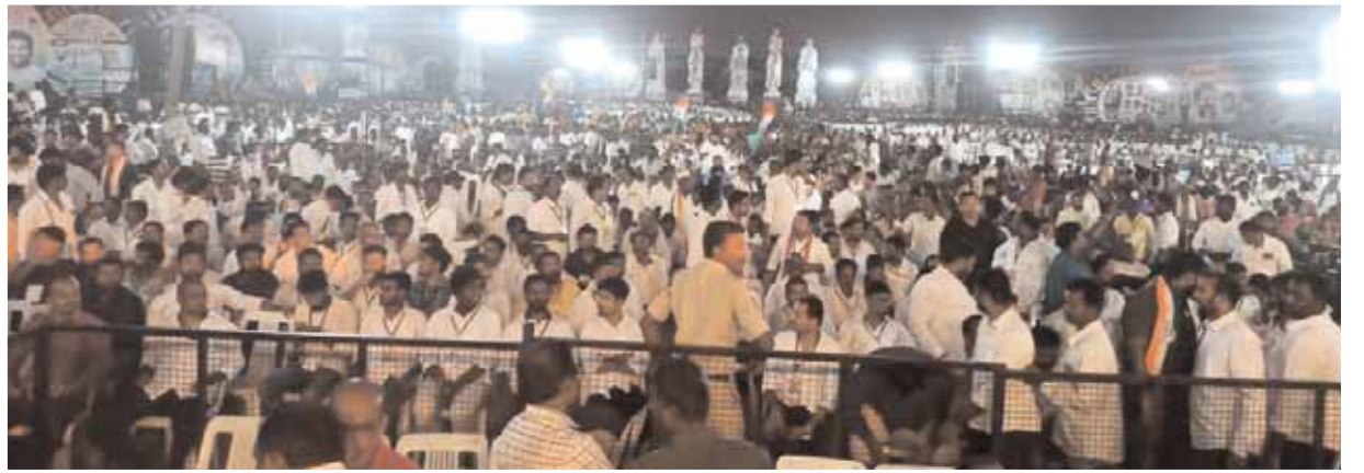
మేక్వల్ జిల్లా ప్రతినిధి, మేజర్ న్యూస్ (మార్చి 09): హైదరాబాద్ నలు వైపులా రావలంటే మల్కాజిగిరి పార్లమెంట్ ఎంపీ సీటు కాంగ్రెస్ గెలవాలని ఒకే విధంగా అభివృద్ధి జరగాలన్నామెట్రో రైలు,బటి కంపెనీలు మేడ్చల్కు ముఖ్యమంత్రి ఎనుముల రేవంత్ రెడ్డి అన్నారు. మిగతా 3లో

శాంతివనం పార్కులో అగ్ని ప్రమాదం - ఆకతాయిల పనిగా అనుమానం - మంటలను ఆర్జిన ఫైర్ సిబ్బంది