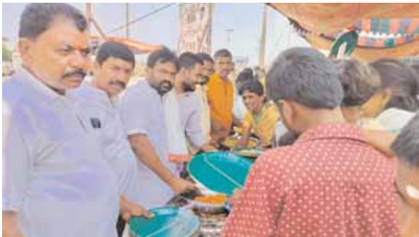
యాచారం మేజర్ న్యూస్ ( మార్చి 09): మండల పరిధిలో నందివనపర్తి గ్రామంలో నందిశ్వర ఆలయంలో శివపార్వతుల కళ్యాణం శనివారం వైభవంగా