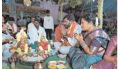
శంషాబాద్, మేజర్ న్యూస్ (మార్చి 09) : శంషాబాద్ మండల పరిధిలోని పెద్దగోల్కొండ గ్రామంలో

కొలువైపున్న శ్రీశ్రీ భగీరథ శివాలయం శివపార్వతుల కళ్యాణం జాతర కార్యక్రమం శనివారం అంగరంగ వైభవంగా నిర్వహించారు. ఉదయం ఉదయం గణపతి పూజ, వరలక్ష్మీ పూజ, నవగ్రహ పూజ, అంజనేయ స్వామి పూజ, శివపార్వతుల ఊరేగింపు కార్యక్రమాలు వైభవంగా నిర్వహించారు. అనంతరం శివపార్వతుల కళ్యాణం భక్తజన సందోహం మధ్య వ:బవంగా నిర్వహించారు. అనంతరం భక్తులకు అన్న ప్రసాద కార్యక్రమం తెలంగాణ దూండాం, రాత్రి 10 గంటలకు భజన సత్సంగ కార్యక్రమాలు